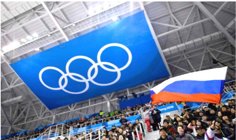
مباراة: الجماهير تلوح بالعلم الروسي خلال مباراة بين رياضيين روس يشاركون تحت لواء العلم الأولي

□ لوزان (سويسرا)، 1 (أ ف ب) - دفعت الرياضة الروسية ثمن التنشيط المنهج لدولتها غياب علمها عن أولمبياد طوكيو الصيفي العام المقبل وبكين الشتوي عام 2022 بعد قرار محكمة التحكيم الرياضية امس في لوزان، في آخر فصل من الملحة المستمرة منذ فترة طويلة. وخلص القضاة الذين عينتهم أعلى محكمة رياضية في العام، إلى النصف عقوبة الاستبعاد لأربع سنوات التي اقترحتها الوكالة العالمية للتحكيم لمكافحة المنشطات.