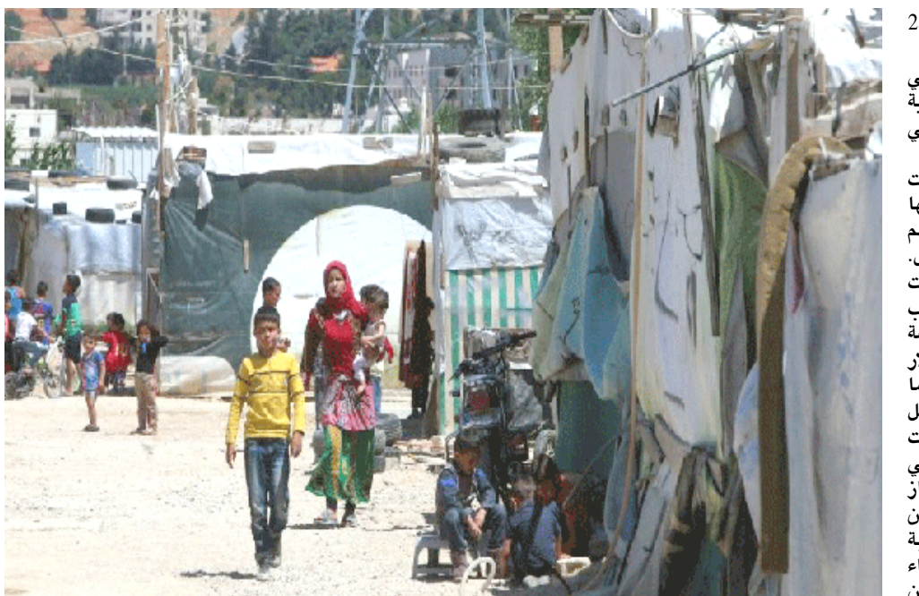
معيةة: لاجئون سوريون في مخيم في مدينة زحلة في محافظة البقاع شرق لبنان

8200 ليرة لبنانية على الأقل. وكان من نتيجة ذلك أن تضاعفت الأسعار عدة مرات. وأوقفت المصارف من جهتها التعامل بالدولار وقبضت السحب باللميرة اللبنانية. وواجهت الجامعات صعوبة في التعامل مع انخفاض قيمة العملة، ولا سيما بسبب حفاظ الحكومة على السعر الرسمي الثابت.