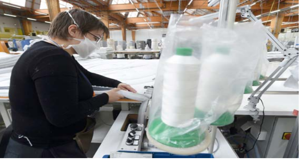
مصنع، عاملة تحيط فرشاة في مصنع بوليتكس في نوايان

وضع حرج. الصناعة في فرنسا تساهم بنسبة 13 بالمئة في إجمالي الناتج الداخلي. هذه تبلغ هذه النسبة 25 بالمئة، أما فرنسا يواجه وضعاً حرجاً، لكن لم يفت الأوان لتصحيحه وقال بايرو في مقابلة مع صحيفة لو جورنال دو ديمانش إن كل العالم أدرك أنه لا يمكن أن ندعم ماليا نموذجا اجتماعيا سخيا إلى هذا الحد ما لم يكن لدينا جهاز الإنتاج الذي يمكن تمويله عبر الضرائب والرسوم والمساهمات. وإضافة لكون من وجهة النظر هذه، فرنسا في