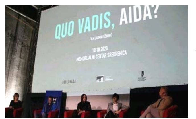
لقطة من مهرجان فيستيفال ديزارك

□ غونويل (أ ف ب) - فاز فيلم (كو فاديس، عايدة) وهو الخامس للمخرجة البوسنية ياسميلا زيمانيتش عن مجرزة سريبرينيتسا، بجائزة (السهم الكريستال) في الدورة الثامنة عشرة لمهرجان (فيستيفال ديزارك) في فرنسا الجمعة الماضية المخصص منذ العام 2009 لتشجيع السينما الأوروبية المستقلة. كذلك منحت جائزة الجمهور لهذا الفيلم الدرامي التاريخي الذي