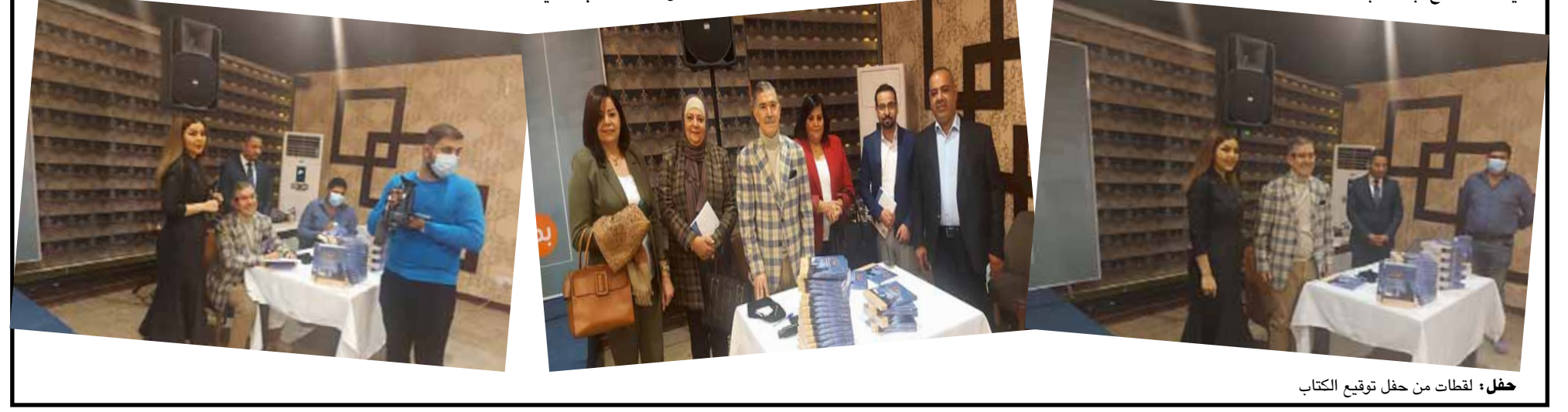
حفل إطلاق من حفل توقيع الكتاب

مشيرا الى اصل الفكرة التي أطلقها في محاولة وصفها ب "المختونة" بعد الإحتلال الأمريكي للعراق عندما طلب من زملاءه الذين هم اليوم شركائه في الشركة المستقلة للأبحاث تنفيذ استطلاعا للرأي العام في بغداد بسال عينة البحث عن وجهات نظرهم في التغيير ما بعد نيسان 2003 ووسط ذهول هؤلاء الزملاء في حينه استطاع بحاسبة