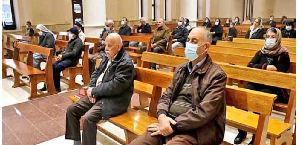
صلاة مسيحيون يؤدون الصلاة في كنيسة بالوصل

بعد هزيمة التنظيم، بدأ المسيحيون في العودة تدريجيا إلى مناطقهم، ومن بينها بلدة