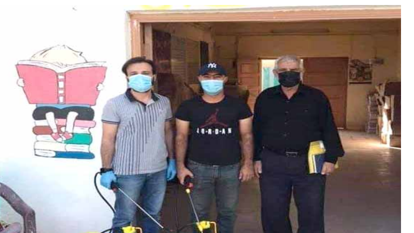
فريق تعقيم مدارس النجف

المحافظة ، وان اللجنة حرصت على توفير بيئة دراسة صحية خالية من المسببات المرضية وبالأخص فابروس كورونا المستجد). مضافا ان (الوباء ينتشر بصورة سريعة بدون ظهور علامات اصابة على الأشخاص . وأشار ناصر : الى ان هذه الحملة تم تنفيذها بالتزامن مع بدء العام الدراسي الجديد (2021 - 2020) حيث تم تعفير القاعات الدراسية