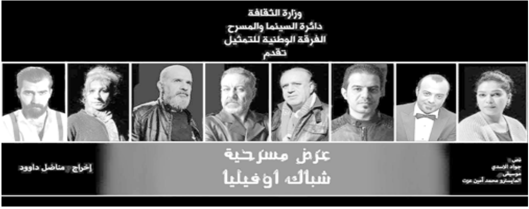
عرض مسرحية شباك أوفيليا

بغداد - ياسين ياس ضمن فعاليات الفرقة الوطنية للتمثيل تم عرض مسرحية (شباك أوفيليا) على خشبة المسرح الوطني لمدة ثلاثة ايام اعتبارا من الارباء الماضي. المسرحية من تأليف جواد الاسدي وخراج مناضل داود الذي قال عن المسرحية ( النص يفتح شهية