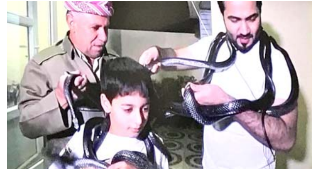
جولة : لقطات من جولة برنامج (كلام الناس) في دهوك