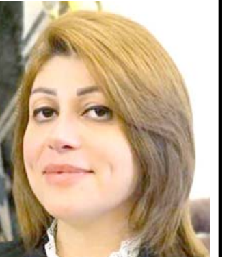
ايفان فاتق جابرو

الاقتصاد الوطني ويوفر فرص عمل كبيرة للعاطلين). وقال عضو مجلس النواب عن محافظة ديالى النائب رياض التميمي ، ان الاتاوات في السيطرات مستمرة بموافقة مسؤول محلي في ديالى وقال التميمي لـ ( الزمان ) ، انه (لاأسل السيد ما تزال علاقة جسيمة الاتاوات غير القانونية مستمرة في محافظة ديالى، رغم تكثفنا التفاصيل منذ فترة ليست بالقصيرة، ولكن الاستجابة الاقتصادية لم تكن بالمستوى المطلوب) . واضاف التميمي، ان (عملية جسيمة الاتاوات في السيطرات تتم من قبل نقابة العمال بموافقة المسؤول الامني الاول محافظ ديالى الذي منح ربح بذلك، وفق وثائق موثقة) . جهات اخرى وتابع التميمي (لس فقط نقابة العمال هي من يجني تلك الاتاوات وانما هناك جهات اخرى في السيطرات ايضا تقوم ببيع العمليه، التي اكر انها غير قانونية وذلك محاسية المسؤولين علنا فياقتها (فورا) . وخاطب، رئيس الوزراء القائد العام للقوات المسلحة مصطفى الكاظمي، بالقول (انت مسؤول امام الله والشعب، وانت تسمع الان مخاطبة ومناشدة الالهية في المحافظة، لتخليص العائدين وفرض القانون، وانهاء ملف الاتاوات التي تاخذ غصبا من الناس) . متوفرة نحن مستعدين لمساعدة السلطة الاتحادية، في حال التحرك لضبط السيطرات الامنية ومحاسبة القائمين على تلك الاعمال المشينة ومن يقف خلفهم ممن يتسودن الموقف في محافظة ديالى) .