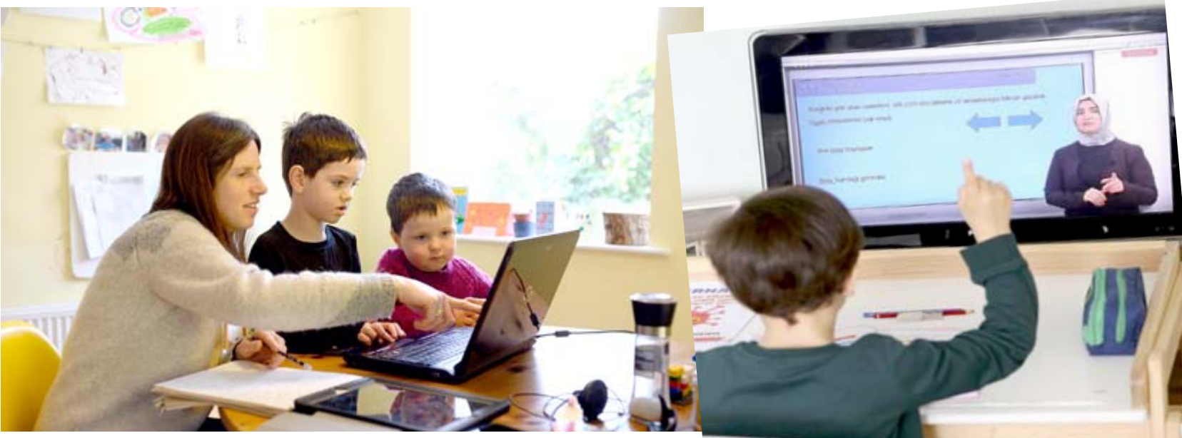
تعليم: تلاميذ يتابعون دروسهم عبر الشبكة الالكترونية