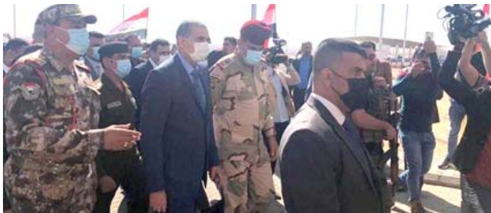
افتتاح: عثمان الغامبي يتجول في منفذ عرعر الحدودي بعد افتتاحه

في يوم 28 تشرين اول عام 1963 انطلقت مصفحات واليات الفرقتين الاولى بقيادة الفريق الركن عبدالطيف نوري والثانية بقيادة الفريق الركن بكر صدقي العسكري