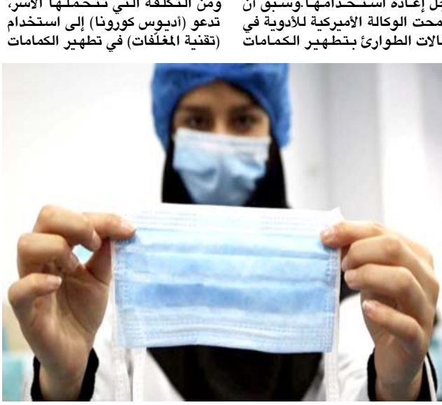
كمامة: جدل بشأن إعادة استعمال الكمامة أكثر من مرة

وهذا ما أفضت إليه اختبارات عملية غسل ثلاث كمامات بقدرات تنقية تبلغ 95 بالمئة جزيئات بحجم 3 ميكرون في الغسالة على حرارة تبلغ 60 درجة مئوية ووضعها في آلة تجفيف الغسيل ثم تحت الكواة، عشر مرات، افندھا في اقصى الحالات خمسة بالمئة فقط من قدرتها على التنقية. وهذا الأسبوع أكدت المجموعة الفرنسية أنه "على الرغم من تليد تطيف، الكمامات الطبية المعسولة توازي من حيث القدرة على الحماية أفضل الكمامات المصنوعة من الأقمشة، وربما تتخطاها. وخلصت اختبارات اجراها فيليب (تسيه) الفرنسية لهندسة النسيج في روبيه، على ثلاثة أنواع من الكمامات إلى نتائج مماثلة وظهرت دراسته انه بعد غسلها خمس مرات على الأقل (لا يوجد عمليا أي فرق في تنقية) جزيئات بحجم 3 ميكرون. الفرق يظهر في تنقية الجزيئات الأصغر حجما) وذلك بحسب نتائج أولية لم تنشر بعد، وفق الباحث، وهو يعتبر ان هذه الكمامات ويقول إن "الغسل من دون حماية البيئة ويقول تساي لوكالة فرانس برس (بهدف الحد من الاستهلاك وحماية البيئة، اوصى عامة السكان بإعادة استخدام الكمامة بعد سبعة أيام وذلك ما بين خمس وعشر مرات. على غرار ما أفعل) ويشير الخبير المتقاعد الذي اعاد عمله في جامعة تينيسي بعد أزمة كوفيد-19 إلى إمكان وضع الكمامة في الفرن وتعريضها لحرارة كافية لقتل الفيروس من دون إحراق المواد البلاستيكية، موضحاً "يجب ان تتراوح الحرارة بين 70 و 75 درجة مئوية. لكن تساي يوصي بعدم غسل الكمامات ويقول إن "الغسل من دون