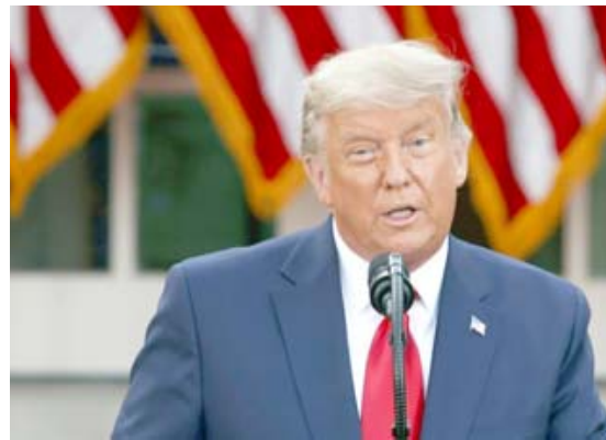
كلمة: الرئيس الأمريكي ترامب خلال القائه كلمة

ستكون (موجودة). اعتقد ان الوقت كفيلا بان يخبرنا بذلك ثم وقف كترام جانبا بينما حولى مسؤولون آخرون المتحدث عن الاجراءات التي تقوم بها الادارة لمخاضة فيروس كورونا الذي اودى بحياة 243 الف شخص في الولايات المتحدة. لاحقا غادر كترام المؤتمر في حديقة ورود في البيت الابيض دون الرد على المراسلين الذين كانوا يطرحون اسئلة من بينها متى ستعترف بحسارتك الانتخابات، سيدني. وهذه التعليقات هي الاولى لترام منذ 5 تشرين الثاني نوفمبر عندما ادعى فوزه وقال ان الانتخابات تم تزويرها ضده. واعلنت وسائل اعلام اميركية الجمعة ان بايدن فاز بولاية جورجيا، ليصل عدد الأصوات التي نالها في المجمع الانتخابي حتى الآن الى 306.