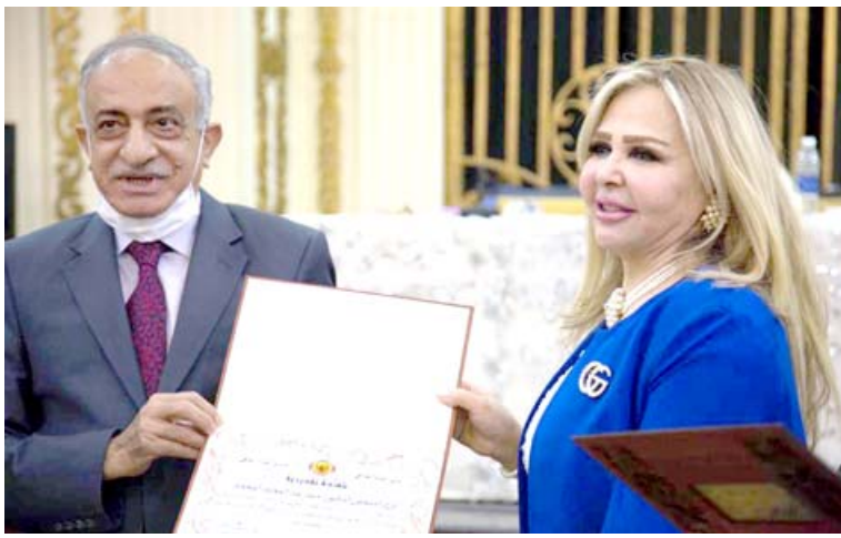
شهادة: تقديم شهادة تقديرية الى (الزمان)

بغداد - الزمان احيا جمهور عريض من رواد واعضاء نادي الصيد العراقي في المنصور، ذكرى يوم تاسيس المنصور، في جو احتفالي شهده ايضا حشد من الاكاديميين والادباء والنخب الثقافية والهندسية، والقي الباحث محمد حسن الحسيني محاضرة عن بغداد الماضي مستعرضا مآثر مدينة غيرت وجه التاريخ بعلمها ومدارسها ومكتباتها وعلمائها وبيئتها الجغرافية والعمرانية. كما القى حسين الجاف وفوزي اكرم ترزي وعدد اخر من الاعلام كلمات تشييرية الى مآثر المدينة التي أسسها ابو جعفر المنصور عام 145 للهجرة