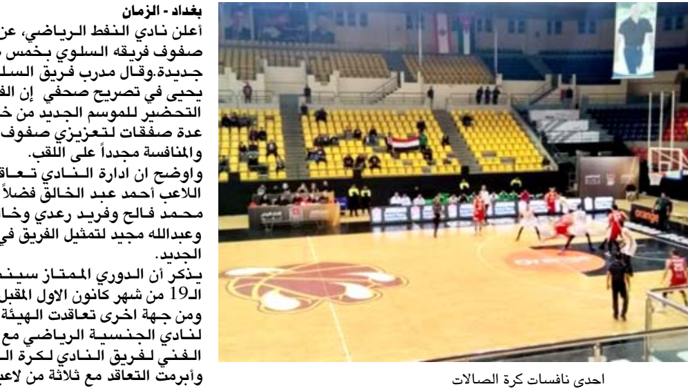
أحدى نائفات كرة الصالات