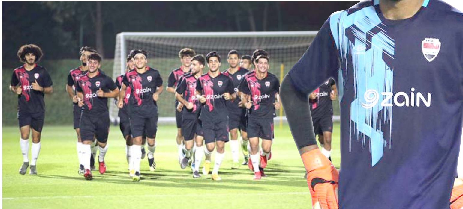
تدريبات: يجري منتخب الشباب تدريباته استعداداً لمواجهة قطر ودياً