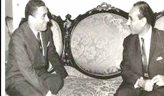
هيكل مع عبد السلام عارف

وظل رئيساً لتحرير جريدة الأهرام 17 سنة، وفي تلك الفترة وصلت الأهرام إلى أن تصبح واحدة من الصحف العشرة الأولى في العالم. وكانت له مكانة متميزة عند الرئيس جمال عبد الناصر الذي عينه عام 1970 وزيراً للإرشاد القومي، ولأن عبد الناصر تربطه مع هيكل صداقة بين رجل دولة وبين صحفي متمسك بمهنة الصحافة، فإن المرسوم الذي عينه وزيراً للإرشاد القومي نص في نفس الوقت على استمراره في عمله الصحفي كرئيس لتحرير الأهرام.