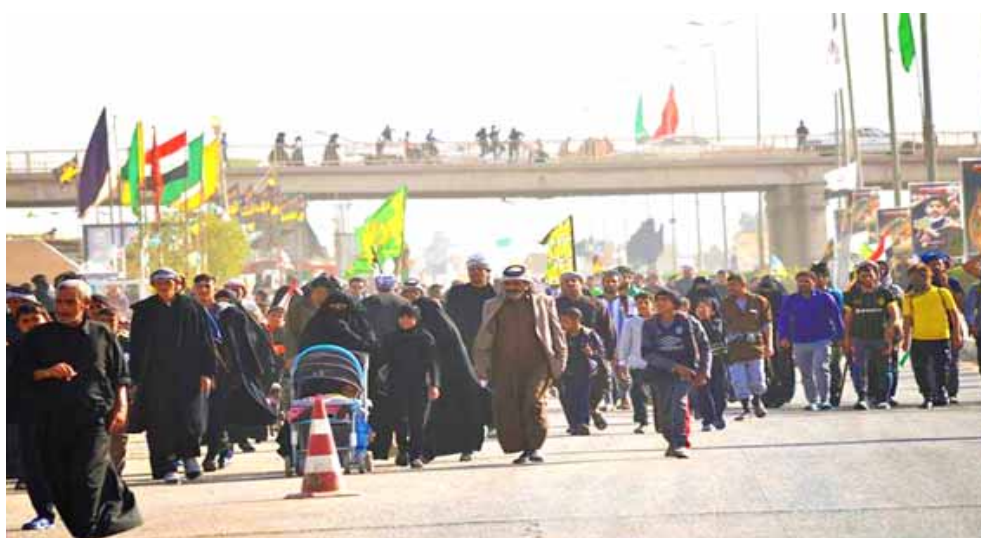
زيارة: الاف زوار يتجهون مشياً الى كربلاء