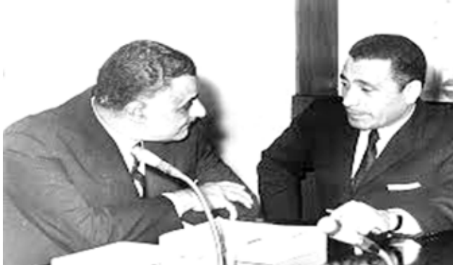
هيكل مع جمال عبد الناصر

هيكل بعد الأهرام لكنه ظل يكتب ويمارس العمل الصحفي ويؤلف كتباً أصبحت من مصادر التاريخ المصري ومنها مؤلفاته باللغة العربية 27 كتاباً إضافة إلى 5 مجلدات من القطع الكبيرتضمن مقالاته