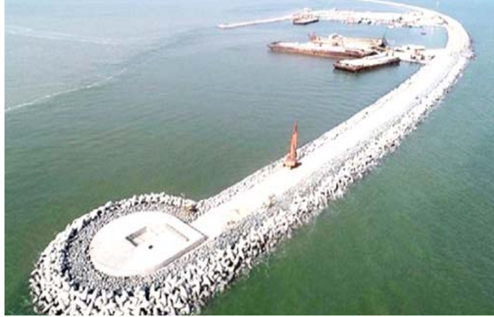
ميناء فاو : منظر علوي لمرحلي العمل في ميناء الفاو الكبير

رابعاً وبمتوسط تخفيض بلغ 31 الف برميل يومياً. وتلتها كازخستان ثانياً وبمتوسط بلغ 22 الف برميل يومياً وتلتها البحرين ثالثاً وبمتوسط بلغ 15 الف برميل يومياً ومن ثم جاءت عمان رابعاً وبمتوسط تخفيض بلغ الف برميل يومياً ومن ثم انديجان خامساً وبمتوسط تخفيض بلغ الف برميل يومياً والسودان سادساً وبمتوسط تخفيض بلغ الف برميل يومياً. وأكدت ان (الدول التي رفعت انتاجها النفطي من خارج منظمة اوبك شملت روسيا وبمتوسط ارتفاع بلغ 45 الف برميل يومياً وتلاهها جنوب السودان ثانياً وبمتوسط ارتفاع بلغ 39الف برميل يومياً ومن ثم جاءتها بريطانيا ثالثاً وبمتوسط ارتفاع بلغ 8 الاف برميل يومياً). وافادت المنظمة في وقت سابق ان سعر سلة الاوبك اليومي انقل على اكثر من 42 دولاراً للبرميل الواحد.وقالت المنظمة في بيان ان (سعر سلة اوبك من ثلاثة عشر برميل للخام سجل 42.07 دولار