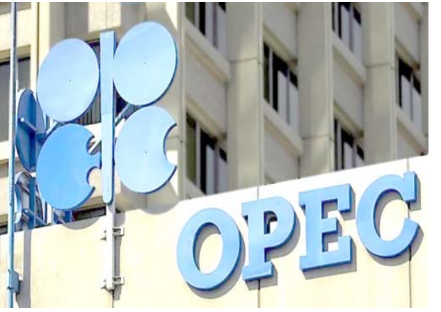
شعار منظمة اوبك

بغداد- قضي منذر أعلنت منظمة اوبك، ان العراق جاء بالمرتبة الاولى بين الدول الأكثر تخفيضاً للإنتاج النفطي داخل المنظمة لشهر آب الماضي.وقالت المنظمة في وثيقة داخلية طلعت عليها (الزمان) امس ان (العراق كان أكثر الدول