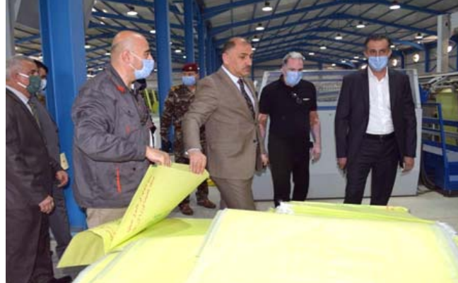
زيارة: وزير الصناعة يزور العامل

بغداد - فائز جواد تابع وزير الصناعة والمعادن منهل عزيز الخباز سير العملية الإنتاجية في مصانع البصدي التابعة إلى الشركة العامة لصناعات النسيج والجلود كما تفقد احوال العاملين فيها وذلك خلال جولة ميدانية