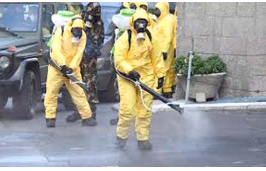
مكافحة: إجراءات لمكافحة فايروس كورونا المستجد في شوارع بودابست

الف إصابة معلقة في 11 تموز/يوليو، ومذاك تضاعف عدد الإصابات المشخصة خلال أكثر من شهر ونصف الشهر. وبعد ان كانت شهر قارة بضرها وباء كوفيد-19 أصبحت أسما من جديد المنطقة التي تسجل أعلى عدد إصابات في المجموع، بلغ عدد الإصابات المعلقة حسب هذا التقاعد 25 مليونا و 29 ألفا و 250-بينهما 842 ألفا و 915 وفاة، وسجلت أربع من كل عشر إصابات في الولايات المتحدة والبرازيل وهما البلدان الأكثر تضرراً وبلغ عدد الإصابات في الولايات المتحدة خمسة ملايين و 960 ألفا و 652 182 ألفا و 760 وفي البرازيل ثلاثة ملايين و 846 ألفا و 153 شخصاً 120 ألفا و 262 وفاة، ويبدو أن وتيرة انتشار الوباء تستمر في العالم حيث تسجل نحو مليون إصابة إضافية كل أربعة أيام منذ منتصف تموز/يوليو. ويفصل 94 يوماً بين الإعلان رسمياً عن أول إصابة في الصين وإحصاء مليون إصابة في العالم، ثم مر 149 يوماً بينها 286-بينها وفاة والشرق الأوسط 214995