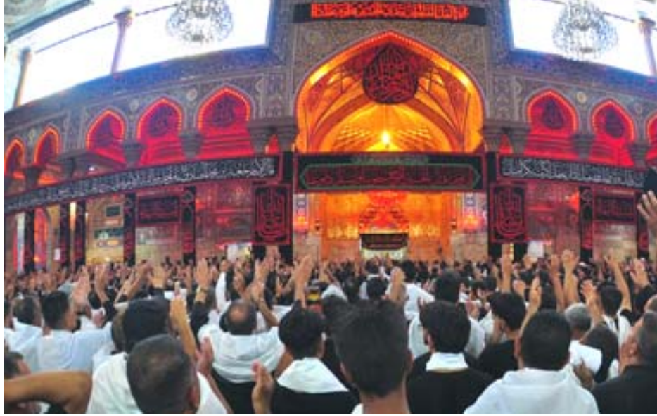
مراسم: الروضة الحسينية في مراسم عاشوراء

وبين الحساني ان اللافتات تضمنت مختلف العبارات من اقوال وبيات شعر قيلت في حق ابي عبد الله الحسين ، واقعة الطف الاليمية احياء لذكرى وقعة كربلاء الاليمية ومصاب ال بيت رسول الله) . موضحاً انه (تم تزيين الأجزاء المباركة للصحن الحيدري الشريف بالالفتات الخضراء المؤطرة بالورود في ليلة الولاية الميمونة لسلام علي، كذلك نشرت ملاكات شعبة التطهير لوحات فنية متميزة بشعبه المناسبة للصحن الشريف . موضحاً ان (توسيع أرجاء المرقد العلوي المطهر بالالفتات ومظاهر الزينة ، جاء تيمناً بولاية الإمام الرضا عليه السلام).