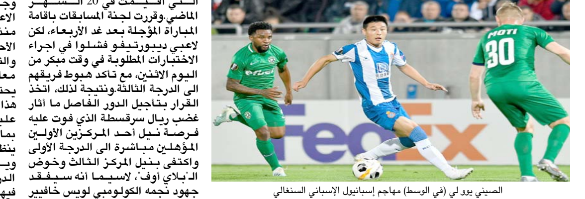
السنيي يوي (في الوسط) مهاجم إسبانيول الإسباني السغالي

□ مدريد، (أ ف ب) - طالب إسبانيول بإلغاء الهبوط في دوري الدرجة الأولى الإسباني لكرة القدم، في ظل الفوضى التي تسبب بها تفشي فيروس كورونا المستجد في البلاد، وأنهى إسبانيول البطولة التي توج بلقبها ريال مدريد، في المركز الأخير برصيد 25 نقطة، محققاً فوزاً واحداً في مبارياته الـ11 التي خاضها بعد العودة من توقف لثلاثة أشهر نتيجة تفشي كوفيد-19 مقابل تعادلين وثمانين خسارات، وقال النادي الكتالوني الذي تناوب على تدريبه في هذا الموسم المضطرب أربعة مدربين، في بيان له إن ما حدث كان "غير عادل بل أشك بالمعنى الرياضي، نظراً إلى أن في المرحلة الأخيرة (بعد الاستئناف) من الدوري لم يكن المنافس بنفس الظروف المتساوية كالسني كانت قاسمة قبل التعليق، وأصبحت مسألة الصعود والهبوط بين الدرجتين الأولى والثانية في إسبانيا قضية شائكة بعد مباراة المرحلة الأخيرة في الدرجة الثانية بين فوينلابرادا وديبورتيغو لا كورونيا والتي أزعجت نتيجة إصابة العديد من لاعبي الأول بفيروس كوفيد-19.