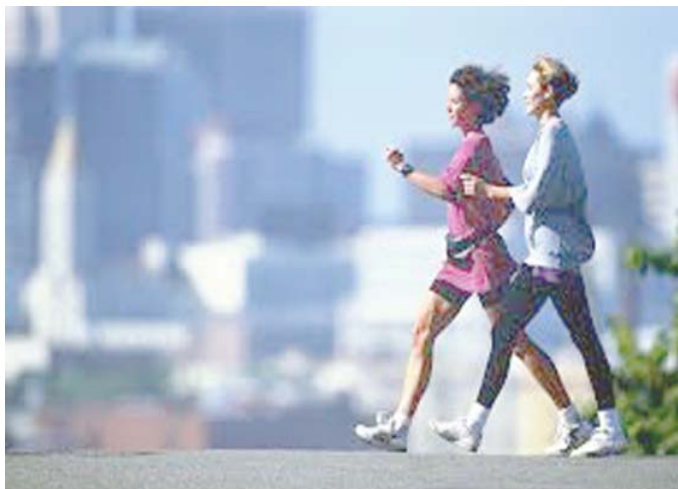
المنشي : رياضة المشي علاج لمكافحة كورونا

تخفيفه الى النصف في هذه الفترة كونها عوامل مساعدة لنشاطات الفيروس-وياتي في الصدارة الاهتمام بالنظافة الشخصية واتباع الاسواق او حال الموه الرسمي) ولا