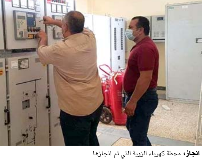
انجاز محطة كهرباء الزوية التي تم انجازها