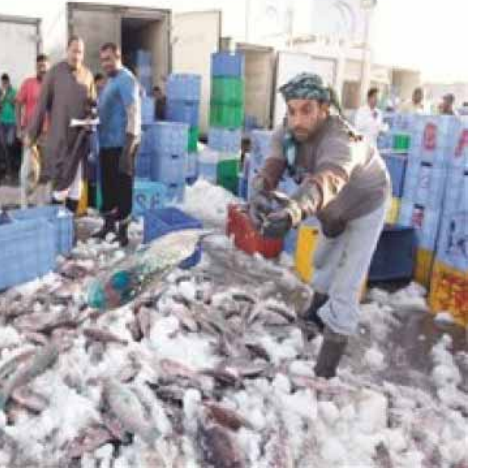
عامل في احد محلات بيع الاسماك

نصيب في صحتها وبدات اسال عن اسماء وانواع وجبتها الشبيهة ..ويصلت اجري ببحث مسدى مصداقية علامها بان صحتها من اعلى صحوح بالعالم وهنا المفاجئة فعلا انها من ضمن الاطياق لانها تحتوي على انواع من الحيوانات القابلة للنقراض بالله سوف تاكل وجية بعد سنوات ليس لها وجود كما سعيده هي وعائلتها بهذا الانجاز ..نعم هذا حال معظم الحيوانات لاادراك لمدى جرائمنا بحق التوازن البيئي ولا استئمتي نفسى ضمن القائمة دخلت المطبخ لعداد وجبت الغداء وكانت تحضير وجية سمك وانا اقوم بغسلها فتفاجى بكثرة البيض في احشاءها انها بالمئات بدون مبالغة