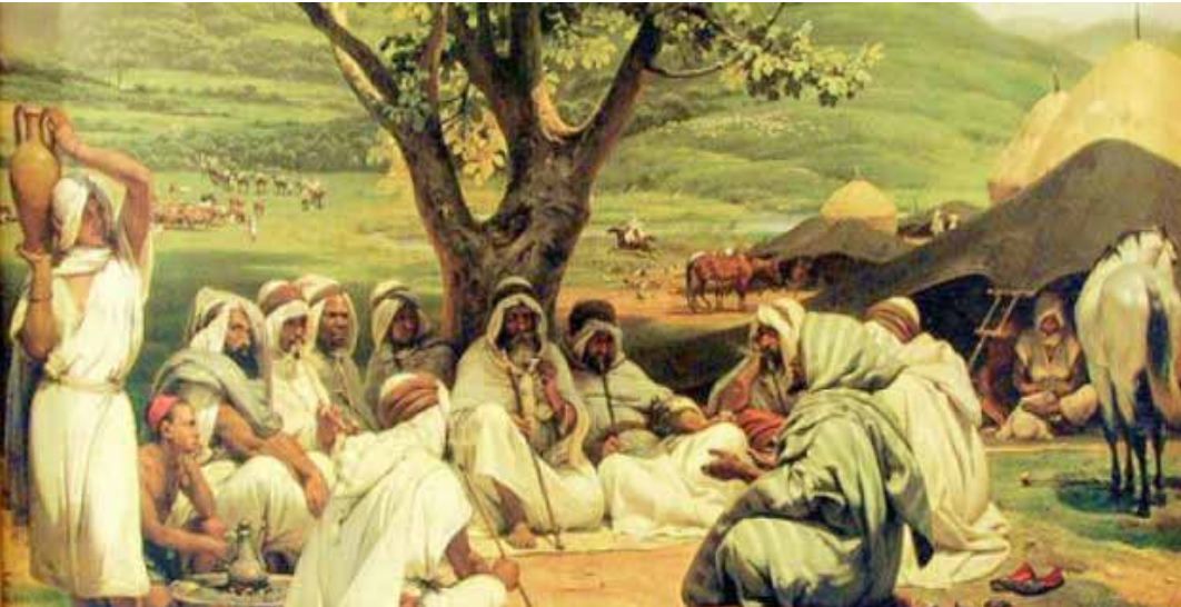
احدى القبائل العربية في العصر الاسلامي