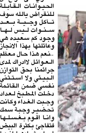
عامل في احد محلات بيع الاسماك

بينما كنت مع اتصال باحدى صديقاتي اخذت تتباهي بوجبة اعداد الغداء البحرية كانت عبارة عن انواع من حيوانات البحرية من السلمك مع سرطعون وتحدثت بكل تشويق بنوع نادر سوف تكون لها