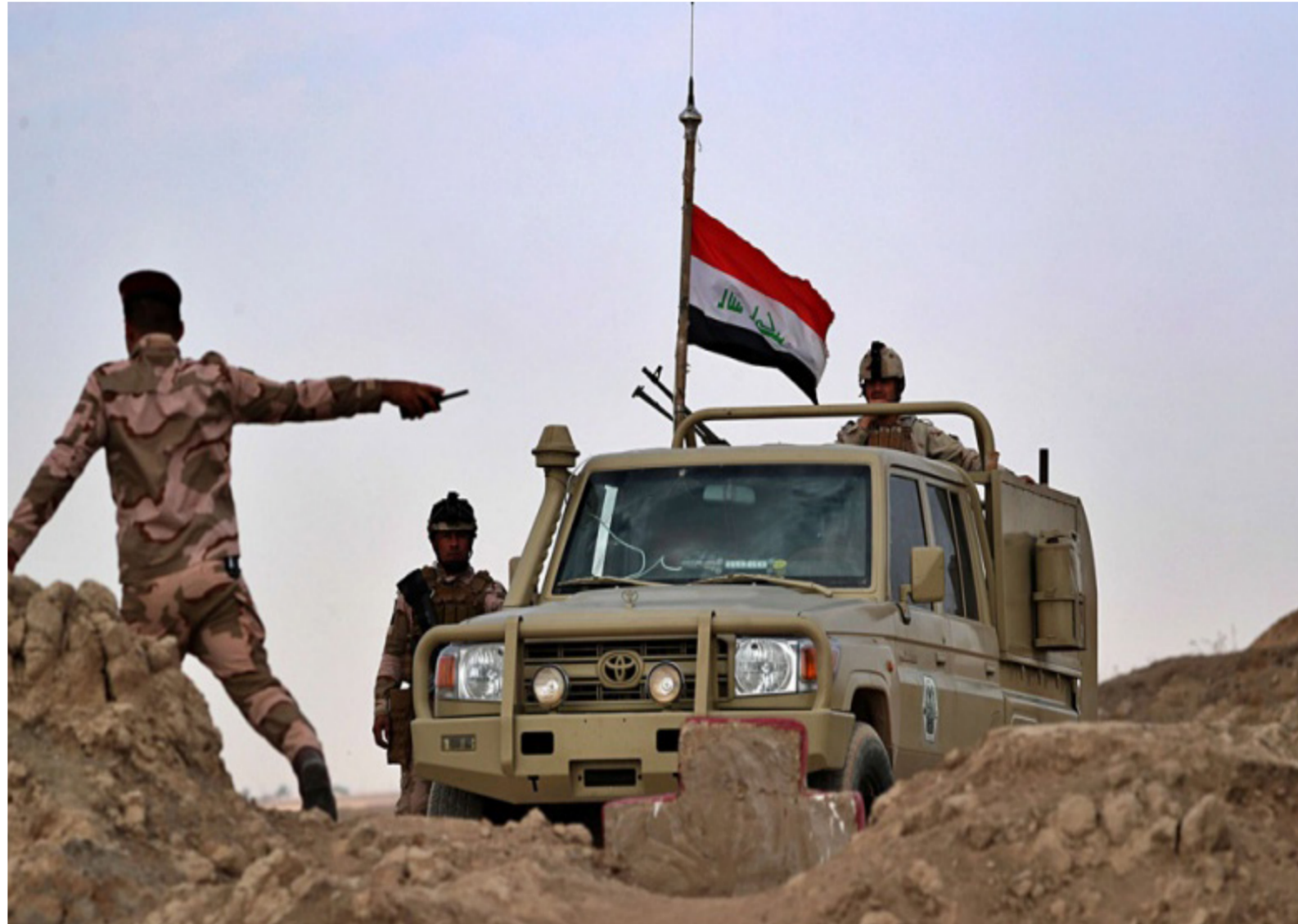
بغداد - الزمان