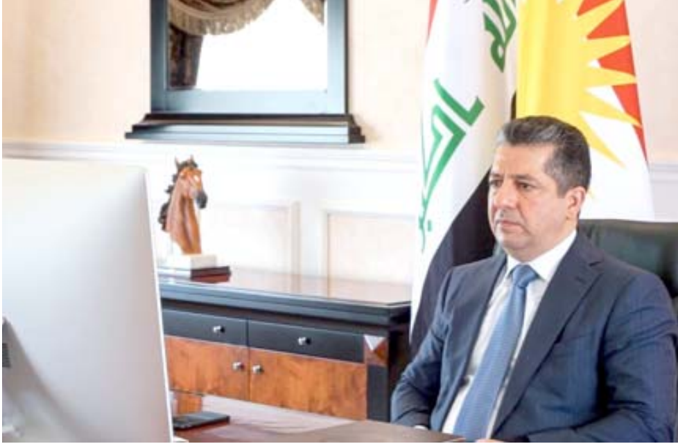
أشرف: مسرور البارزاني يشرف على اجتماع اللجنة العليا لمواجهة فيروس كورونا عبر دائرة تلفزيونية مغلقة

الصحية مما أدى إلى تزايد الإصابات والوفيات يوماً بعد آخر، وقال (لذا أهاب بجمع المواطنين صرة أخرى الالتزام بالإجراءات الوقائية للحفاظ على سلامتكم وسلامة أقرابكم والمجتمع).