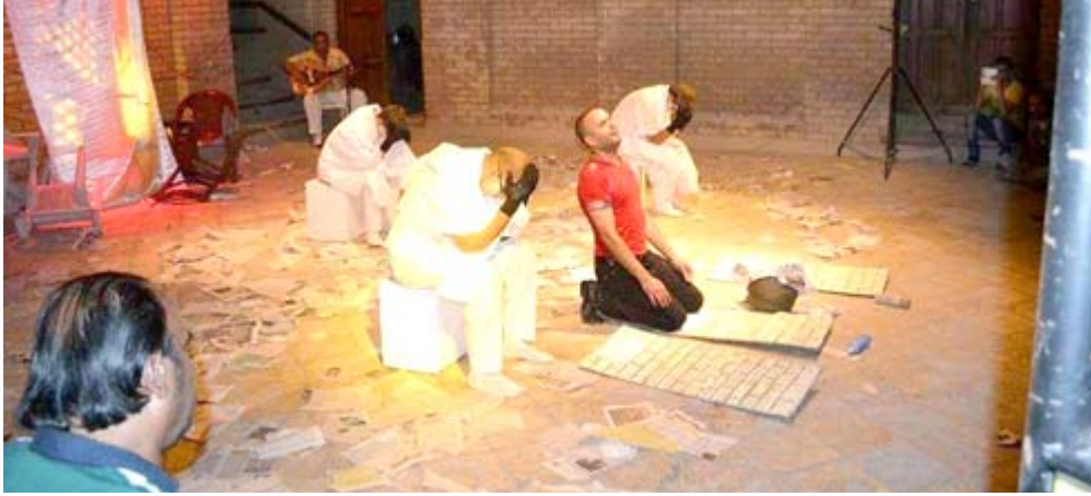
على اخراج الصورة المسرحية بشكل أكثر احترافية للمتفرج).

النص قد كتب خلال السنوات (2018-2019) وان يناقش القضايا العربية والعالمية حول خدش أو اساءة لكون أو شخص أو جهة . . وأوضح السوداني (من بين الشروط أيضا ان لا تتجاوز القراءة النصية 30 دقيقة فقط وتقتل نصوص الأطفال والمونودراما والنصوص الشعرية والملتقى في صفحاتهم فيما سينظم الملتقى جلسات نقدية لكل نص مشارك على ان يلزم المشارك في تثبيت البرنامج الخاص بالث الرقمي الذي يتم ابلاغه عنه من قبل الادارة الفنية للملتقى وارسل سيرة ذاتية مع صورة شخصية وأيضا النص على عنوان محترف ميسان الإلكتروني ويرفق معها اسم الكاتب، اسم البلد، اسم النص، تاريخ كتابة النص ونوع النص). وختم (نتنظر مشاركة كتاب النص عربيا وعالميا في واحدة من اهم الملتقيات الفريدة من نوعها وسنعمل