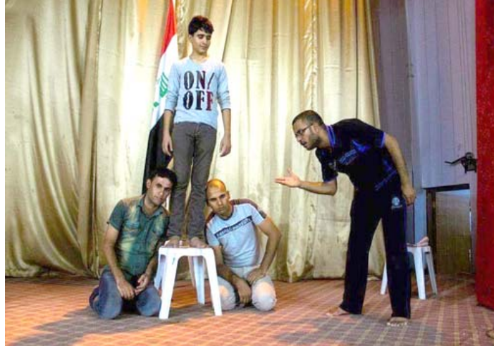
المسرحي لـ (الزمان) (بعد النجاح الكبير الذي تحقّق في الدورة الاولى من مهرجان محترف ميسان الدولي للمسئودراما اونلاين 2020 والذي اختتمت فعالياتها في ايار من العام الحالي وبمشاركة سبعة دول عربية فقد عقدنا العزم على تنظيم ملتقى يوسف العاني الدولي للقراءة