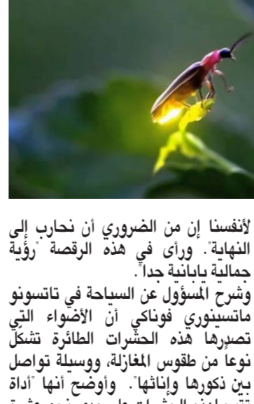
تنتج لهذه الحشرات على مدى نحو عشرة

عشرة أيام في شهر حزيران/يونيو، ويشكل الفصل الأخير من حياة حشرات سراج الليل، في حياتها التي تدوم ستة فحسب، لا تلمع هذه الحشرات إلا في الأيام العشرة والخمسة عشر من حياتها، لكي تترك من بعدها نريتها، على ما شرح رئيس بلدية تاتسونو يازوو تاكي لوكالة فرانس برس. وأضاف عندما نرى استعراض هذه الأنوار السريعة الزوال، لا يمكن إلا أن نتأثر ونقول