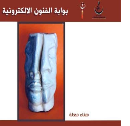
ملصق ترويجي لمعرضي علي شريف وهناء معلقة