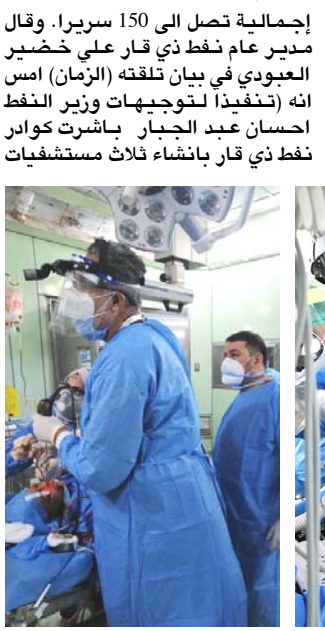
جراحة : فريق طبي في مدينة الصدر الطبية في النجف يجري عملية جراحية