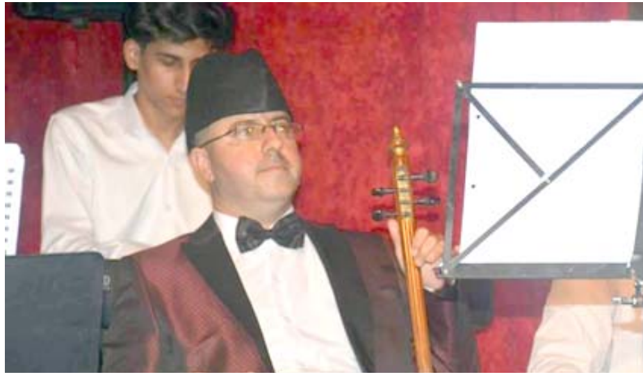
إبداع : نشاطات موسيقية متواصلة لأتار العمار