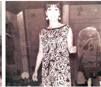
الراحلة رجاء الجداوي في عرض للأزياء بحضور أم كلثوم

القاهرة-الزمان كثير من النجمات في عالم الفن انطلقن في بداياتهن في مجال عرض الأزياء. وفي السطور التالية نتعرف على بعضهن وفقاً لتقرير موقع الفن: ان كانت الممثلة نبيلة عبيد عارضة أزياء قبل ان تصبح من اهم نجمات التمثيل في الوطن العربي. وكذلك الحال مع الممثلة رجاء الجداوي كانت عارضة أزياء شهيرة