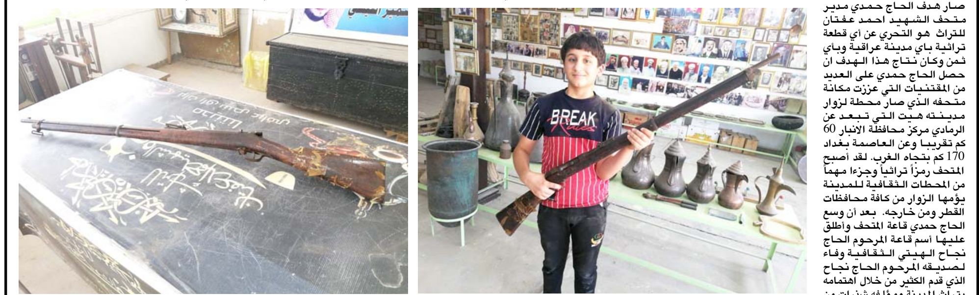
بندقية الشيخ ضاري الحمود محمولة بيد صبي داخل متحف هيت