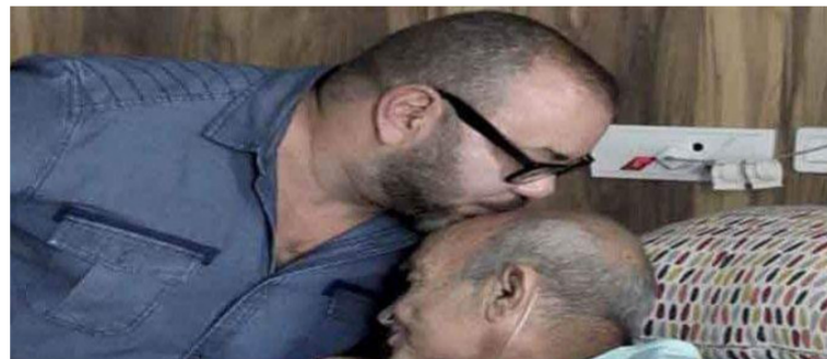
الملك محمد السادس مع عبد الرحمان اليوسفي