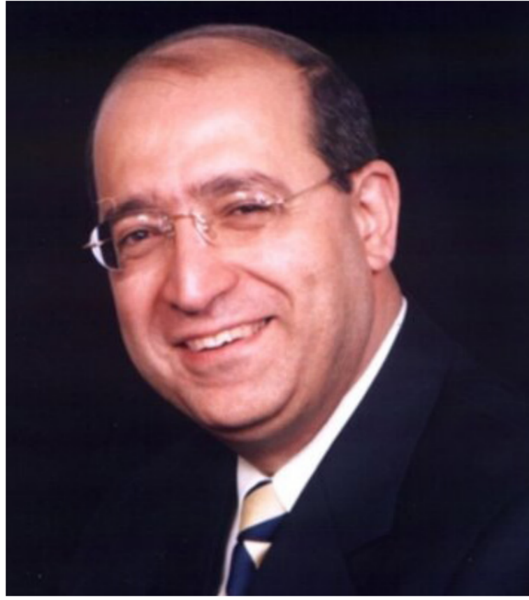
د. حسين القاصد

من استشارتهم المستشارة ميركل المتخصصة مثله في العلوم، عندما اضطرت إلى اتخاذ قرار بشأن الحجر الصحي. كما اشتهر من خلال بودكاست للإذاعة العامة يوضح من خلاله كل ما يتعلق بفيروس كورونا المستجد ومخاطره بعبارة بسيطة موجهة إلى الألمان القلقين. ومع ذلك، وفي نهاية نيسان/أبريل، كشف دروستن لصحيفة غارديان البريطانية أنه تلقى تهديدات بالقتل. وقال الثلاثاء إنه تلقى رسالة يفترض أن فيها عينة فحص إيجابي بالفيروس مع رسالة إشرية وستستبرك لديك مناعة. وكانت التهديدات خطيرة لدرجة أن وزير الداخلية هورست زيهوفر قال إنه يتابع كل هذا عن كثب مع استراتيجيته عدم التسامح مطلقاً. وبدأت رغبة عينة فحص هذا الأسبوع تقود حملة اتهامات ضد الطبيب الذي تحققي به سائر