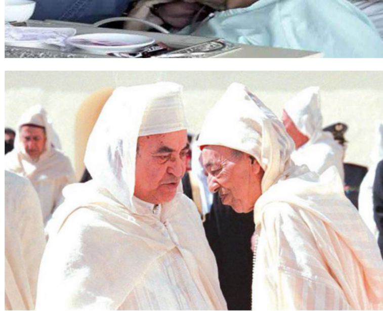
الملك محمد السادس مع عبد الرحمان اليوسفي