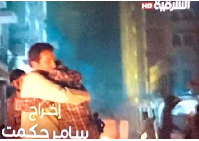
اللغة الختامية من الحلقة 18 من (كما مات وطن)