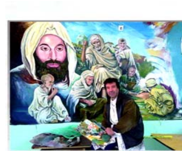
تظلم دائرة الفنون العامة معرضاً للجزائري جميل الوردى

بغداد - انعام العطيوي اطلقت دائرة الفنون العامة الجمعة الماضية معرضاً الكترونياً للفنان الجزائري جميل الوردى. واعرب مدير عام الدائرة علي عويد عن (سعادته باحتضان الفن العربي الي جانب الفن التشكيلي العراقي في الموقع الرسمي لدائرة الفنون العامة من خلال تنظيم هذا المعرض). مشيراً ان (الدائرة اخذت على عاتقها استمرار التواصل مع الابداع ودعم الفنانين في ظل اجراءات الحجر الصحي وتفتسي جائحة كوروننا الوبائي عبر الدائرة وحمل لوحة فنية 15 لوجه فنية للوردى). مبيناً ان لهذا الظرف الاستثنائي مؤكدا ان (هذا المعرض الاول عربياً والخالث فنانين عراقيين وعرب لتنظيم معارض مشتركة في دائرة الفنون، وسيتم قريباً الإعلان عن اول معرض عربي لعشرات الفنانين).