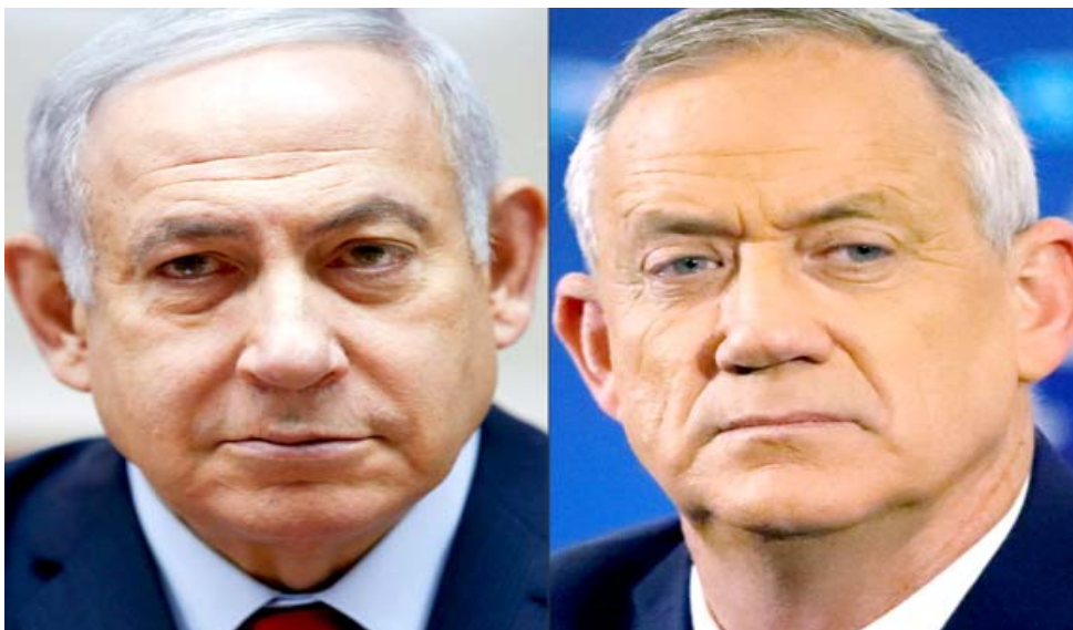
صورتان مدمجتان لرئيس الوزراء الإسرائيلي بنيامين نتانياهو (يسار) وخمسه بيني غانتس

مدرسين- إنّه قد يبطل اتفاق نتانياهو وغانتس ويدفع في نهاية المطاف إلى تنظيم انتخابات جديدة تكون الرابعة في أكثر من عام قبلي. وحذر وزير الطاقة يوفال شتاينيتز في نهاية الأسبوع بأنه في حال رأت المحكمة العليا أنه لا يمكن لنتانياهو تولى رئاسة الحكومة، فسيشكل ذلك زلزالاً. هجوماً غير مسبوق على الديمقراطية.