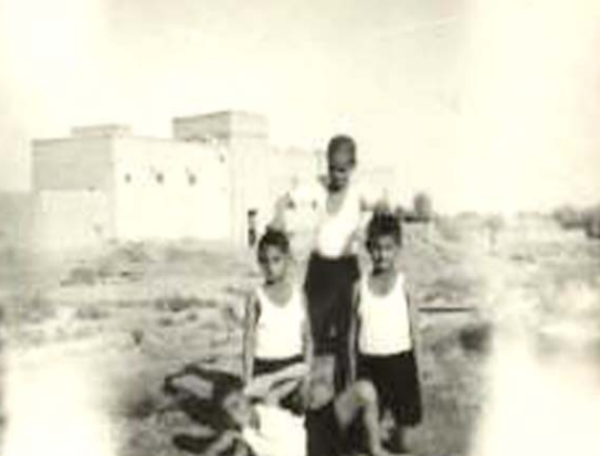
صورة من المدرسة الابتدائية

بناية السراي رغم ضعف الذاكرة بعد اكثر من 70 عاما على تلك الأيام فاشنتي اذكر المشخاب مدينة رائعة (وانا لم اشهد غيرها سوى غماس). اذكر النهر وهو الفرع الرئيسي من الفرات يقع على الجهة الشرقية من المدينة اي أننا اذا جئنا الى المدينة لا بد ان نعبّر النهر وكان ذلك يتم بزوارق مقابل اجور ثم صنعت عبارة (الطبكه) لنقل الناس وحاجياتهم بين ضفتي النهر الى ان اشأت الدولة جسراً عائماً لعبور الناس والسيارات والحيوانات ومع ذلك فقد بقت بعض الزوارق تعمل للعبور بين الضفتين. اول ما تواجها ن نحن القادمين من القرية بناية السراي اي مقر مدير الناحية والشرطة وبقية الدوائر ومنها مكتب البريد والتلغوف في ركن المبني وبالجانبية في ذلك الوقت كان كبار الموظفين في الناحية والشرطة والمدرسة وغيرها تعينهم الحكومة من ابناء