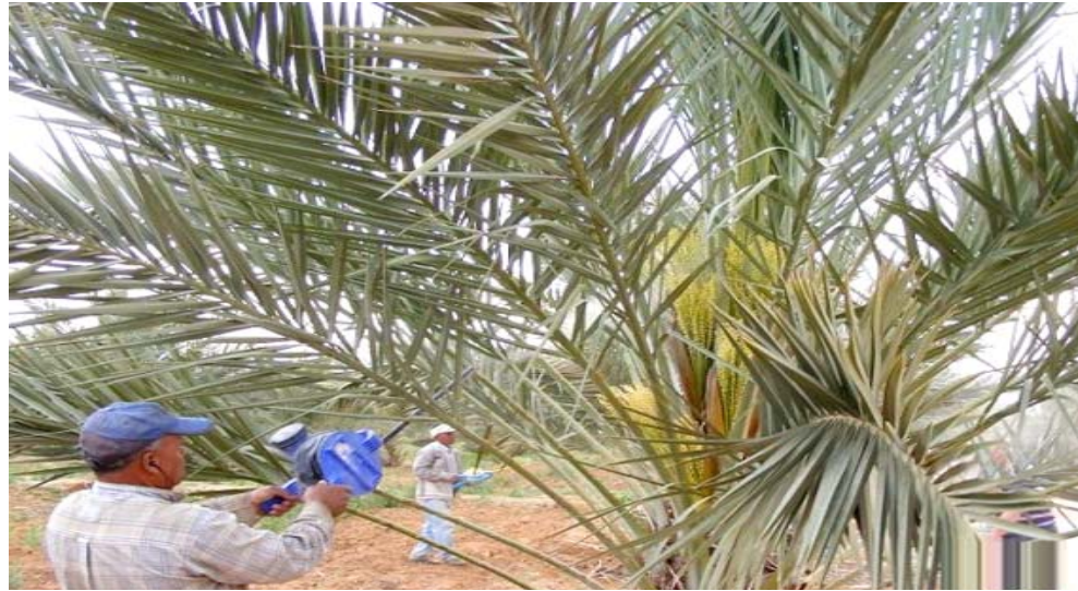
مكافحة: موظف زراعي يكافح حشرة نخيل

دعا خبير اقتصادي ،وزارة الزراعة إلى الاهتمام بإنتاج النخيل لاهميتها في تعزيز موارد الموازنة السنوية التي تعتمد بشكل اساسي على إيرادات النفط.مكتبرا إلى أن العراق يمتلك اكثر من عشرة ملايين نخلة وتقتن أكثر من 450 صنفا. وقال ملاذ الامين لـ (الزمان) امس ان (العناية بالنخيل يعد من الصناعات الان لا يتجاوز نحو 5 في المئة، على ظل توجه الدولة إلى الاعتماد على النفط بحيث يمتلك في ثمانينيات القرن الماضي نحو 30