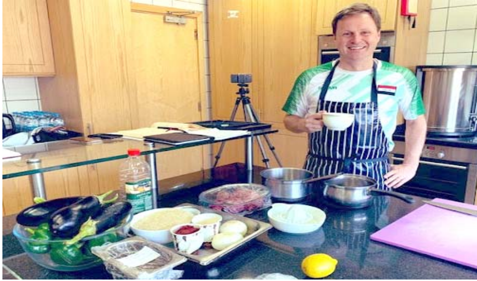
مطبخ في منزل السفير البريطاني في بغداد