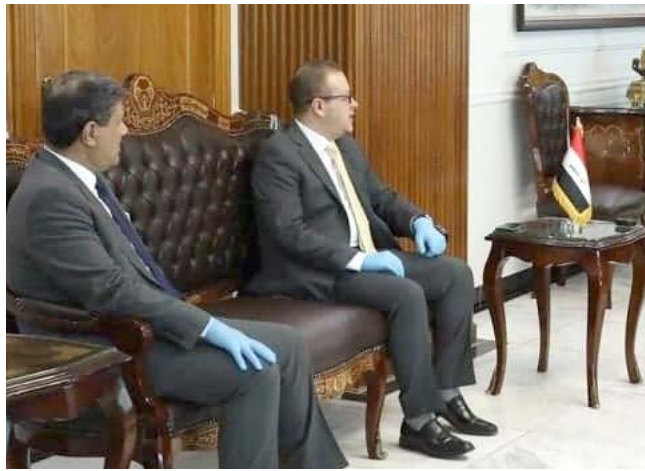
زيدان النواب نينوى مع مسؤولين في مكتبه

محاسبة من يخالف القانون لدفع الكلال عن التنايفر السياسي على القضاء.