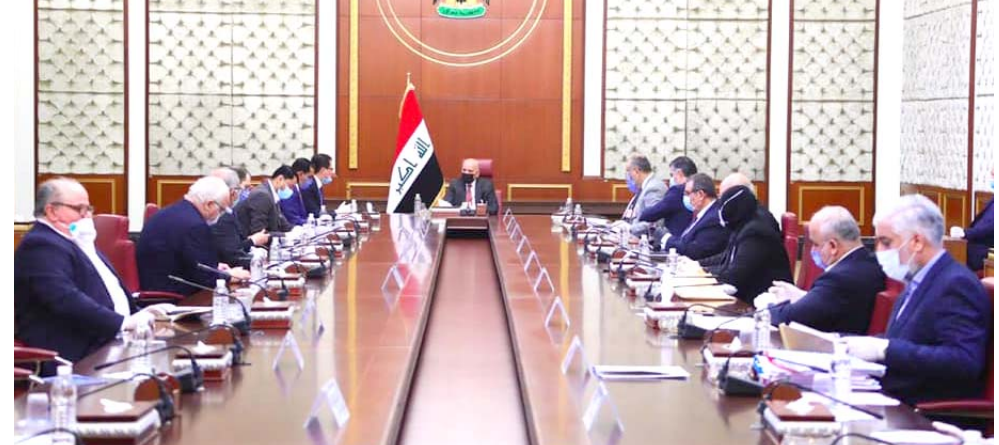
إجتماع : جانب من اجتماع المجلس الوزاري للإقتصاد في جلسته امس