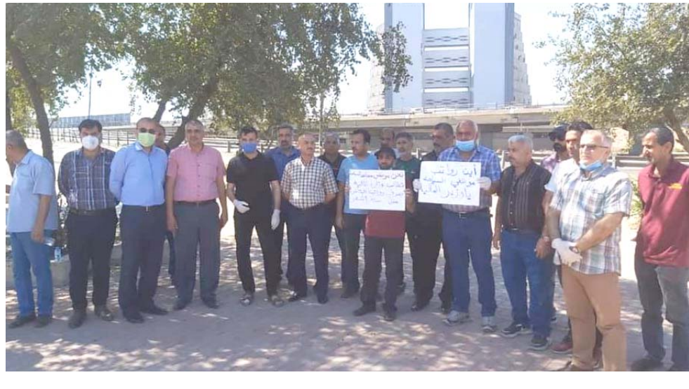
تظاهرة : عشرات الموظفين يتظاهرون امام مبنى وزارة المالية للمطالبة بمستحقاتهم

بغداد -الزمن تظاهر عدد من الموظفين امام وزارة المالية للمطالبة بصرف الرواتب والمستحقات المتأخرة منذ مدة . وقال شهود عيان ان (عددا من الموظفين الذين تم تحويلهم من المعهد السياحي إلى وزارة التربية تظاهروا اول امس امام مبنى الوزارة في بغداد للمطالبة بصرف رواتبهم المتأخرة منذ ستة شهور)، مشيرين الى ان (المتظاهرين هدوا بالتحديد في حال عدم الاستجابة للمطالعة الحقة او تسويةها) من جهة اخرى ، قرر مصرف الرافدين اجراء استيفاء قروض القطاع الخاص لشهرين . وذكر المصرف ان بيان تلقته (الزمن) امس انه ( في ظل الأزمة الصحية التي يتعرض لها العراق جراء تفشي فايروس كورونا ،