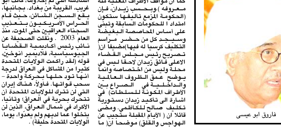
فاروق ابو عيسى

والحرية الاساسية وشغل منصب الامين العام لاتحاد الحقوقيين العرب للمدة من 1983 - 2003 . وأبو عيسى الذي توفي بمنزله في الرياض سياسي بارز بالحزب الشيوعي السوداني ولد بمدينة ومدني عام 1933 ودرس بمدرسة حنتوب الثانوية حيث التحق بالحزب الشيوعي السوداني عام 1950 وشارك ابو عيسى ، في حكومة مايو بقيادة الراحل جعفر النميري ، وتقلد منصب وزير الخارجية ، وفي عام 1983 فاز بمنصب الامين العام لاتحاد المحامين العرب . هاجر ابو عيسى الى مصر بعد انقلاب الإنقاذ عام 1989 وأعيد انتخابه اميناً عاماً للمحامين العرب لعدة دورات حتى عام 2003 . عاد الى السودان عام 2005 بعد اتفاق السلام الشامل ، وأصبح عضواً في البرلمان وتولى رئاسة الهيئة العامة لتحالف قوى الإجماع الوطني .