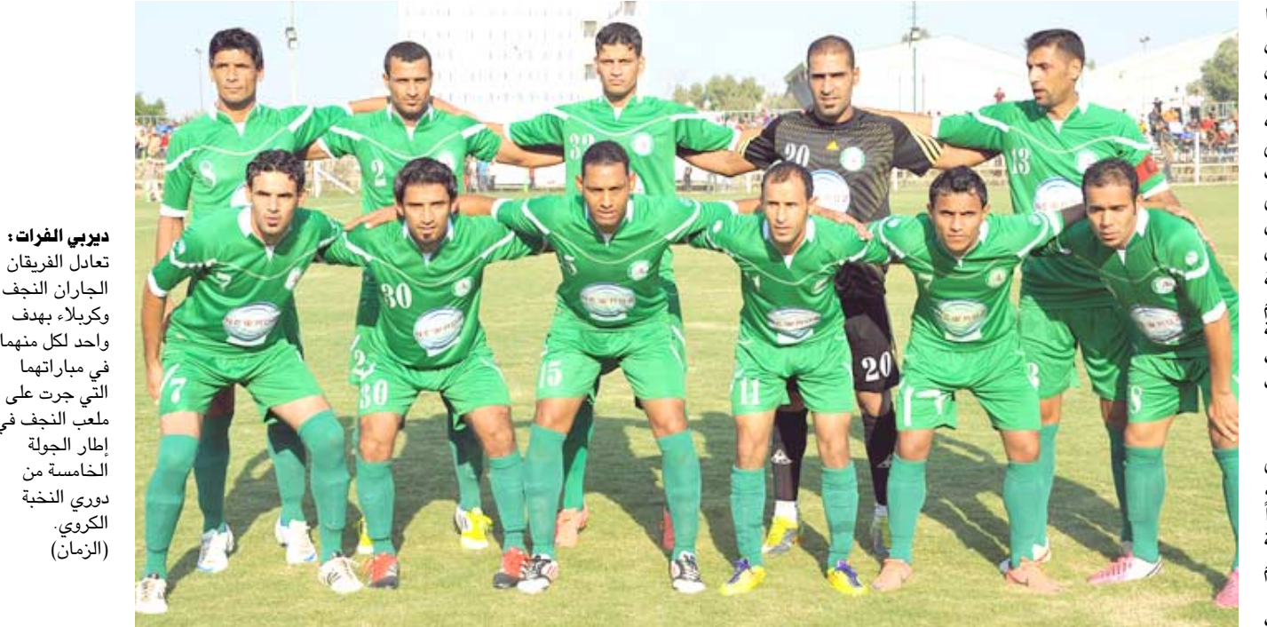
ديربي الفرات: تعادل الفريقان الجاران النخف وكربلاء بهدف واحد لكل منهما في مباراتهما التي جرت على ملعب النخف في إطار الجولة الخامسة من دوري النخبة الكروي.