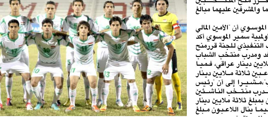
منتخب شباب العراق. (الزمان)

المنتخبين ويغض النظر عن النوع والكم هو حافز يدفع باللاعبين ومدريهم لتقديم الأفضل في الإستحقاقات المقبلة لاسميا في نهائيات كأس العالم للفتين . وكان اتحاد الكرة قرر منح لاعبي منتخب الشباب مبلغ سبعة الاف دولار فيما منح الإداريين مبلغ خمسة الاف دولار تكريما لإنجازهم في الحصول على المركز الثاني في بطولة آسيا فضلا على التأهل لنهائيات كأس العالم. يذكر ان منتخب الشباب تمكن من التأهل لنهائيات كأس العالم للشباب التي ستقام العام المقبل