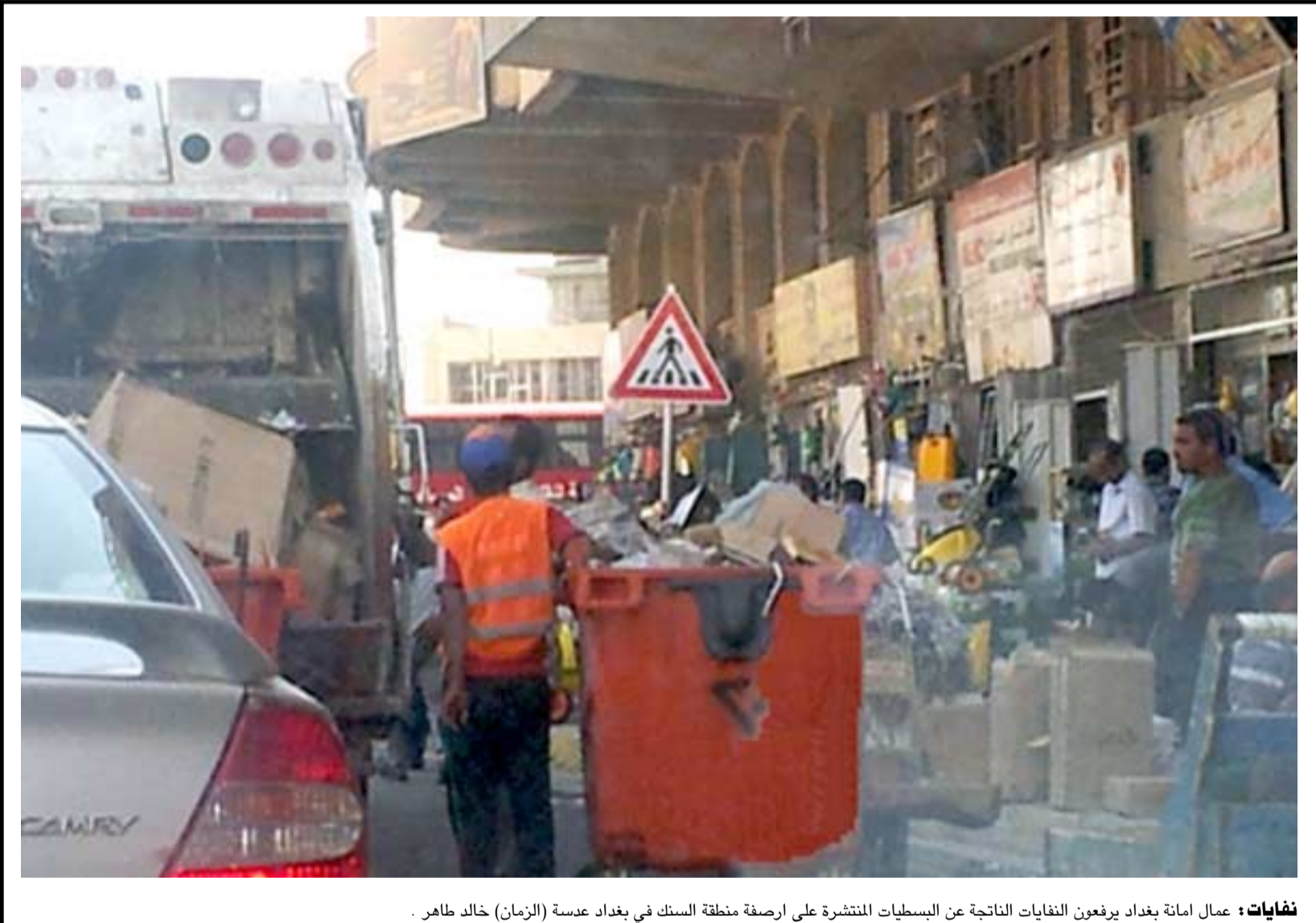
نفايات: عمال امانة بغداد يرفعون النفايات الناتجة عن البسطيات المنتشرة على ارضية منطقة السنك في بغداد عسمة (الزمان) خالد طاهر.

بغداد - الزمان الكوت - علي الفياض انتقد مراقبون في الواقع الصحي والتنمية الطبية ما وصفوه بالتخبطات في اتخاذ القرارات التنموية للقطاع، ففي الوقت الذي تتفق فيه وزارة الصحة مع الجانب البريطاني لتدريب اطباء التخدير العراقيين تقوم محافظة واسط باستقدام اطباء تخدير إيرانيين وتعاقدهم معهم مقابل مرتبات شهرية تصل الى ثلاثة الاف وخمسة دولار. وقالوا ل(الزمان) امس ان (الوزارة لم تضع منهجاً عملياً وخططاً ستراتيجية للتنموية في القطاع الصحي الذي يعاني من التخبط في اتخاذ القرارات)، مشيرين الى ان (القطاع الصحي بعد مضي أكثر تسع سنوات على تغيير النظام لم يشهد تحولاً إيجابياً بالطموح إذ لم