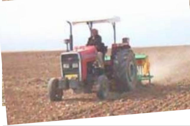
حصاد : الات زراعية تقوم بحصد محصول الحنطة من احد المزارع.

بغداد - علي شطب اعلنت محافظة بغداد عن شراء 200 ساحة زراعية وقالت انها بصدد توزيعها على الاقضية والنواحي لدعم القطاع الزراعي في عموم مناطق العاصمة . ونقل بيان للمكتب الاعلامي للمحافظة تلقته (الزمان) أمس عن المحافظ صلاح عبد الرزاق قوله إن (المحافظة تعتمد وبكل جهدها الارتقاء بالواقع الزراعي في عموم مناطق العاصمة والاطراف والاقضية عبر مساندة الفلاحين والمزارعين ومنحهم القروض وتجهيزهم بالامانات التخصصية فضلا عن تطبيق اجراءات المبادرة الزراعية التي اقرتها الحكومة لدعم القطاع الزراعي في عموم المحافظات). واضاف (سيتم تجهيز الفلاحين والمزارعين والحقول الزراعية في مناطق الاقضية والاطراف والنواحي التابعة للمحافظة بنحو 200 ساحة زراعية لدعم القطاع الزراعي والارتقاء به خلال المرحلة المقبلة فضلا على اجراءات لتاهيل مجزرة الشعلة النموذجية وباقى المجازر الاخرى للحد من الذبج العشوائي في الشوارع والمناطق السكنية).