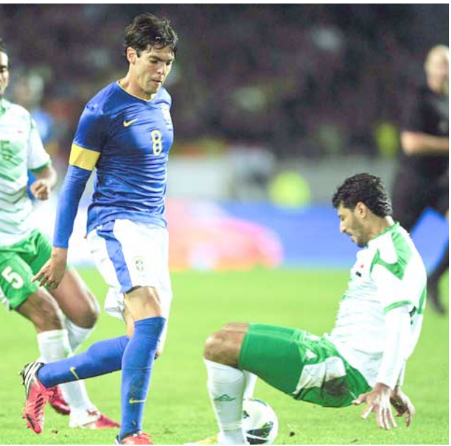
خسارة؛ عاد العراق من السويد بخسارة كبيرة أمام البرازيل.

النتيجة كانت متوقعة مسبقا ومعروفة بان تكون المباراة من طرف واحد هو المنتخب البرازيلي، الفيفا التي ان تصريح زيكو قبل المباراة بان من الواجب ان نتعلم شيئا من المباراة يؤكد ماذهنا اليه.