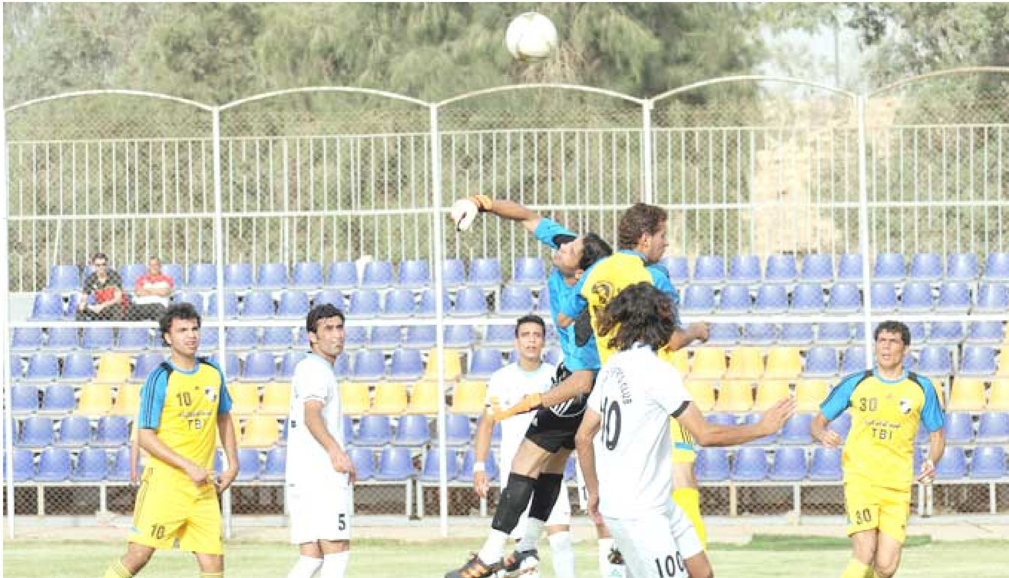
مناسبات الكاس؛ تتواصل اليوم منافسات بطولة الكأس بإقامة مواجهتين في بغداد ودهوك (الزمان)

الناصية - باسم الركابي تجري اليوم السبت الثالث عشر من تشرين اول الجازي مباراتا إياب الدور الثاني لبطولة كأس العراق حيث يستقبل دهوك في ملعبه نفط ميسان في الوقت الذي يقابل فيه الصناعات الكهربائية نفط الوسط. وعلى ضوء نتيجتي المباراتين سيحدد لقاء فريقين و السماح لهما الاستمرار بالبطولة التي ستشهد في دورها المقبل 32 مباريات مهمة ستواجه فيها فرق الدرجتين الممتازة والأولى ويأمل ان ترقى البطولة الى رغبة المتابعين اذا ما حفلت بالمفاجأة واجمل ما في مباريات الكاس ان توظف بالمفاجأة التي تحتاجها البطولة التي ستشهد خروج فريقين الى جانب الفرق الستة التي خرجت من الدور الاول الذي جرت مبارياته وفق خـسـرـوج الغلوب مرة واحدة قبل ان تتواصل المنافسات من خلال اقامة الفرق بأسلوب الذهاب والاياب.