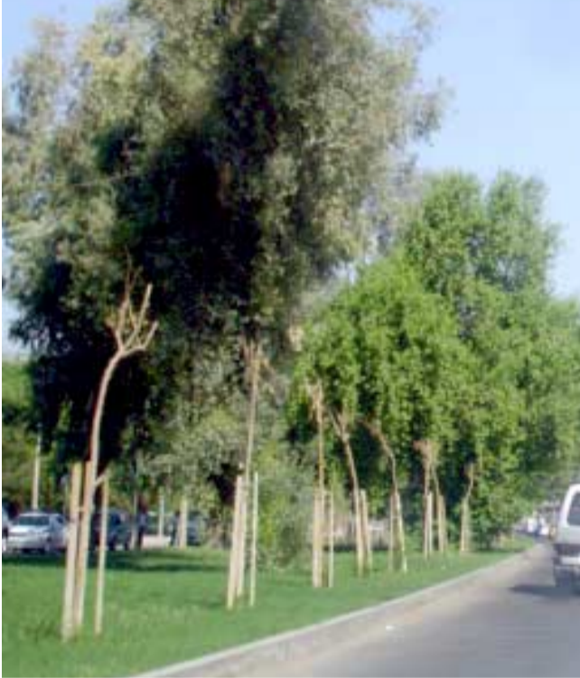
إستعادة : شارع ابي نواس خلف فندق الشيراتون يستعيد رونقه وجماله بعد رفع الحواجز الكونكريتية وإعادة تاهيله عسة (الزمان) علي شطب.