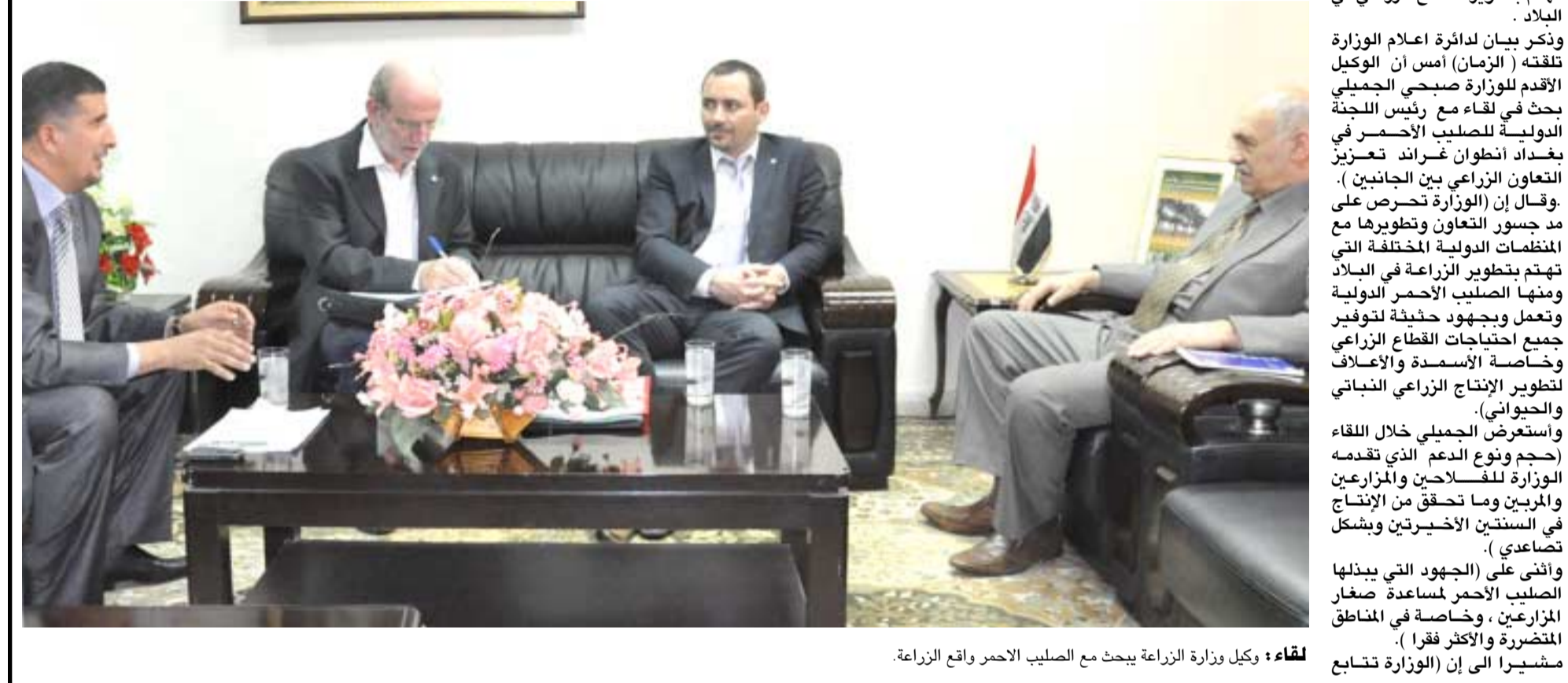
لقاء؛ وكيل وزارة الزراعة يبحث مع الصليب الاحمر واقع الزراعة.