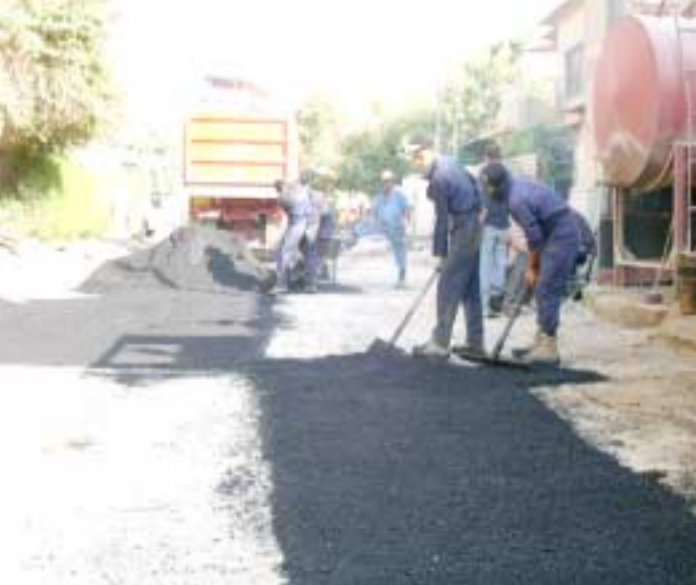
صيانة : مجموعة من العمال يقومون بصيانة وتبليط احد الطرق (الزمان).

بغداد - الزمان كربلاء - محمد فاضل فاخر أعلنت وزارة الإعمار والإسكان ان (شركة اشور العامة للمقاولات الانشائية التابعة لها انجزت اعمال اكساء وصيانة 431 كم من الطرق ضمن المشاريع الحالية اليها). وقال الوزير محمد صاحب الدراجي في تصريح صحفي امس ان (كلفة هذه المشاريع بلغت 307 مليار دينار وهي تنفيذ لصالح الهيئة العامة للطرق والجسور احدى تشكيلات الوزارة). واضاف ان (نسبة كبيرة من تلك المشاريع تنفذ بأسلوب التنفيذ المباشر وخاصة الاشعاء الذي يشكل ما نسبته 50 بالمئة من الاعمال الحالية للوزارة). ويذكر ان شركة اشور تمتلك مجموعة كبيرة من الاختصاصات الهندسية وادارية والفنية والحرفية إضافة الى 20 معملًا لإنتاج مادة المزج القهيري المستخدم في اعمال اكساء الطرق . من جهة اخرى قررت لجنة الاعمار والتخطيط الستراتيجي في مجلس