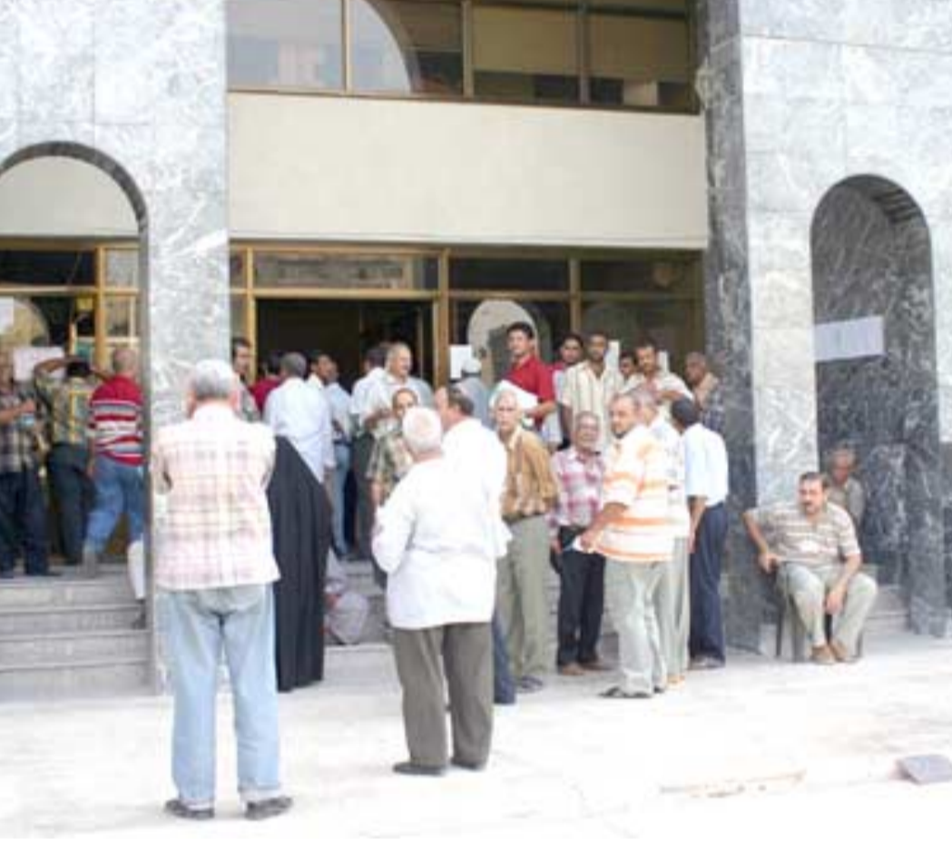
مراجعون : المديرية العامة للتنمية الصناعية حيث يتجمع زخم المراجعين لانجاز معاملاتهم (الزمان)