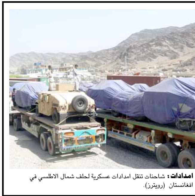
اصدارات : شاحنات تنقل امدادات عسكرية لحلف شمال الاطلسي في افغانستان