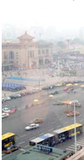
تلوث: مشهد من بكين يظهر مدى تلوثها (رويترز)

بكين (رويترز) طلب عدم نشر اسمه "نحاول تحسين جودة الهواء الهدف ليس فقط اجتذاب الاستثمارات من الخارج... لكننا نفعل هذا من أجل صحة كل سكان بكين... وبالنسبة للمغتربين في بكين خاصة من الغرب لا يمثل التلوث مشكلة سوى في بعض الأجزاء ليست منتشرة كما أن وسائل النقل العامة كثيرا ما تكون مكتظة وسلامة الأغذية تمثل قلقا والرقابية الشديدة على مواقع مثل فيس بوك وتويتر.