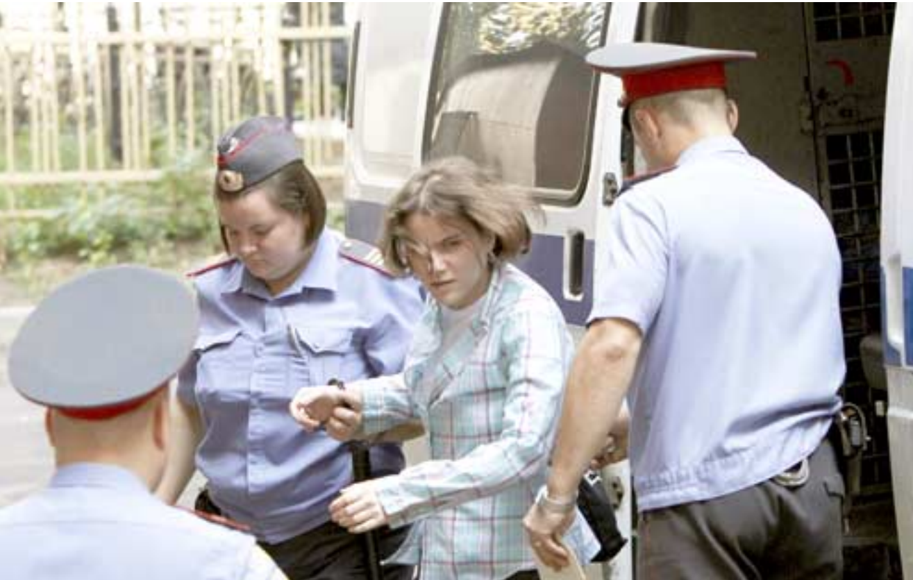
اقتياد: احدى النساء الثلاث اللواتي قمن بالاحتجاج ضد الرئيس الروسي

وقال مدفيديف ان السوريين هم "واضف "جيمعنا ننتقل من الموقف نفسه وهو ان اسوا ما يمكن ان يحدث هو اندلاع حرب اهلية شاملة في سوريا". وقد وفرت روسيا والصين حتى الآن حماية للنظام السوري من العقوبات الدولية، الا ان موسكو تصر على انها تتبنى موقفا متوازنا من الازمة وتنتقد الغرب وبتهمته بالانحياز الى المتمردين السوريين.