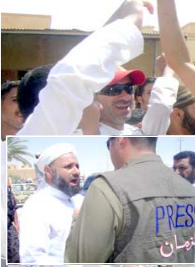
لاجنون : سوري يلغ خلال تظاهرة شهدتها القائم احتجاجاً على اوضاع الإقامة عسة.

وعدت الصحيفة في سياق تقرير اوردته على موقعها الإلكتروني - ان (هذا الامر يحمل في طياته إشارة واضحة الى سماعي تنظيم القاعدة لإعادة تمركزه بقوة في العراق خلال