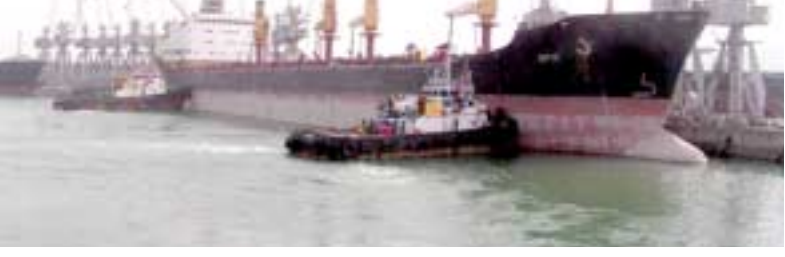
ميناء: سفن تجارية ترسو في ميناء ام قصر لتفريغ حمولاتها عسة (الزمان) سعدون الجابري.

واشار البيان الى ان البواخر التي رست هي ريفان محملة بالكازاوويل ومالك كومندل من اشاكويا بحمولة متنوعة ونور مندي بحمولة 478 حاوية إضافة إلى اربع باواخر من جنسيات مختلفة وبحمولات متنوعة من مادة السمنت وزيت الغاز والبزين واثانيب لحساب شركة نفط الجنوب ضمن جولة التراخيص النفطية).