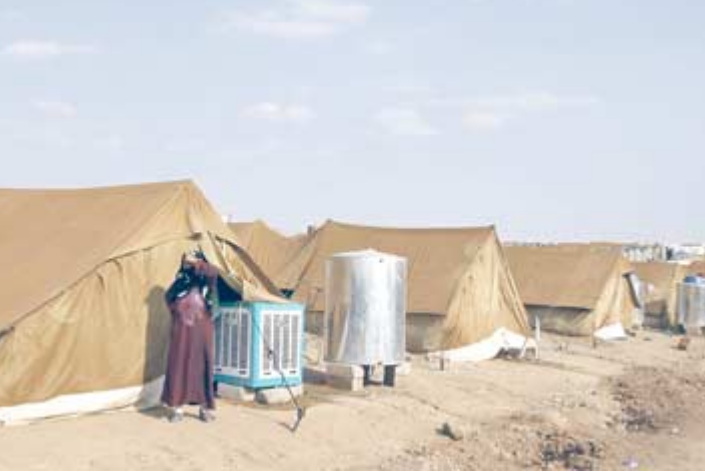
مخيم: أحد مخيمات اللاجئين السوريين قرب دهوك (رويترز).

بغداد - سارة الحديثي أعلنت الخطوط الجوية العراقية انها ستباشر بنقل العراقيين الموجودين في مدينة حلب السورية. وأوضح بيان لوزارة النقل امس ان (بعد نقل جميع المواطنين العراقيين من دمشق إلى بغداد وتسييرها أكثر من 43 رحلة جوية متواصلة من مطار دمشق الدولي إلى مطار بغداد الدولي ستقوم بنقل الجالية العراقية الموجودة في مدينة حلب عن طريق مطار حلب الدولي). وأشار البيان إلى ان (الشركة تحملت مسؤولية نقل المسافرين العراقيين الموجودين في سوريا مجاناً ودون أن يتحمل المسافر العراقي اية نفقة مالية).