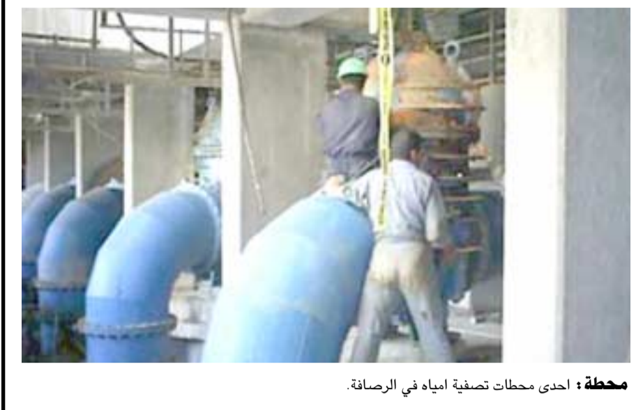
محطة : احدى محطات تصفية امياه في الرصافة