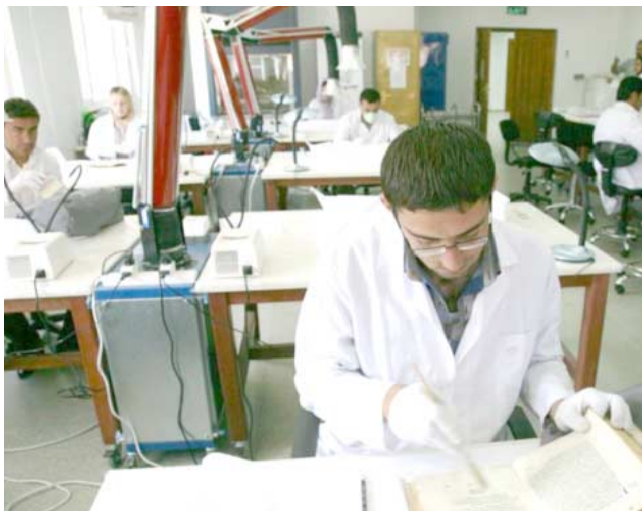
مخطوطات : مشفى لمعالجة المخطوطات الأثرية