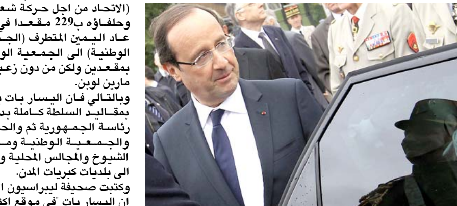
احتفالات: الرئيس الفرنسي اثنا حضور الاحتفالات التي اقيمت في فرنسا لاجلاء الذكرى 72 لنداء الجنرال شارل ديغول (رويترز)

□ باريس - أ ف ب: اصبح الرئيس الفرنسي فرانسوا هولاند غداً حصول اليسار على الاكثورية المطلقة في الانتخابات التشريعية التي جرت الاحد، يمتلك كل قمة مجموعة العشرين والتي سيهيمن عليها ملف اليورو لكن في غمرة أزمة اليورو فان قرارات بالغة الصعوبة تنتظر. وغداً الانتخابات التشريعية التي جرت في فرنسا، وذلك ايضا