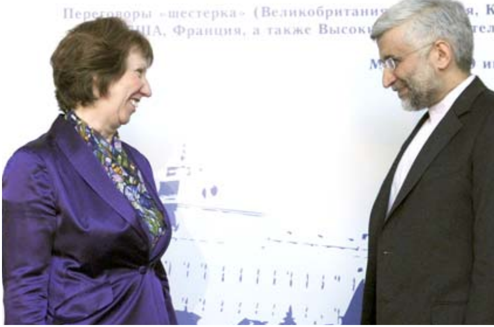
زيارة: وزير الخارجية الإيراني علي لاريجاني خلال لقائه بوزيرة خارجية الاتحاد الاربي اشتون في موسكو

المحادثات في العاصمة العراقية بغداد امس ايار/مايو الماضي، سبقتها محادثات في اسطنبول التركية في 13 نيسان/ابريل الماضي، وصفت بأنها كانت ايجابية. وقال لاريجاني ان إيران بالسعي إلى امتلاك أسلحة نووية، وهو ما تنفيجه طهران التي تصر على ان اهداف برنامجها النووي سلمية. وأشار الرئيس الإيراني محمود احمدي نجاد على ما يبدو إلى استعداد بلاده لوقف تخصيب اليورانيوم لدرجة أعلى إذا وافقت القوى العالمة على توفير متطلباتها المتعلقة بالوقود. وقال احمدي نجاد في تصريحات نشرت على موقع الرئاسة على الانترنت "من البداية اوضحت الجمهورية الإسلامية انه إذا وفرت الدول الأوروبية وقودا بدرجة تخصيب 20 بالمئة لإيران فهي لن تقوم بالتخصيب لهذه النسبة". وقال لاريجاني ان إيران لا تفضي هذه المحادثات إلى توقيع الاتفاق النهائي بين الطرفين. ونقلت وكالة الأنباء توفوستي الروسية عن العضو