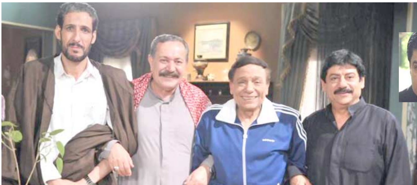
دراما رمضان: نجوم الفن العراقي يتقدمهم بهجت الجبوري و سلام زهرة يشاركون عادل امام ببرنامج رمضان. (الزمان)

الجبوري امام ويقع بنحو 30 حلقة تلفزيونية، يمر المسلسل في دول عديدة منها تركيا، مصر، لبنان، سوريا والعراق والجزء الذي يتحدث عن العراق يبدأ في الحلقة 25 تقريبا وما يمر به من ازمتات ويتحدث عن اصحاب النفوس الضعيفة التي تحاول الصعاب العراق وتهريب وسرقة اثار العراق وطعن حضارته و ايضا الى الذين يخلقون الفتن بين مذاهب ومذاهب ويقفون حجر ضد استقرار العراق من خلال استمرار بعض التفجيرات والخطف والترويع لا اريد ان اتحدث اكثر فسوف ترون العمل ولنهاية المسلسل الذي ان شاء الله سيتم عرضه في رمضان المقبل وعلى اكثر من قناة فضائية.