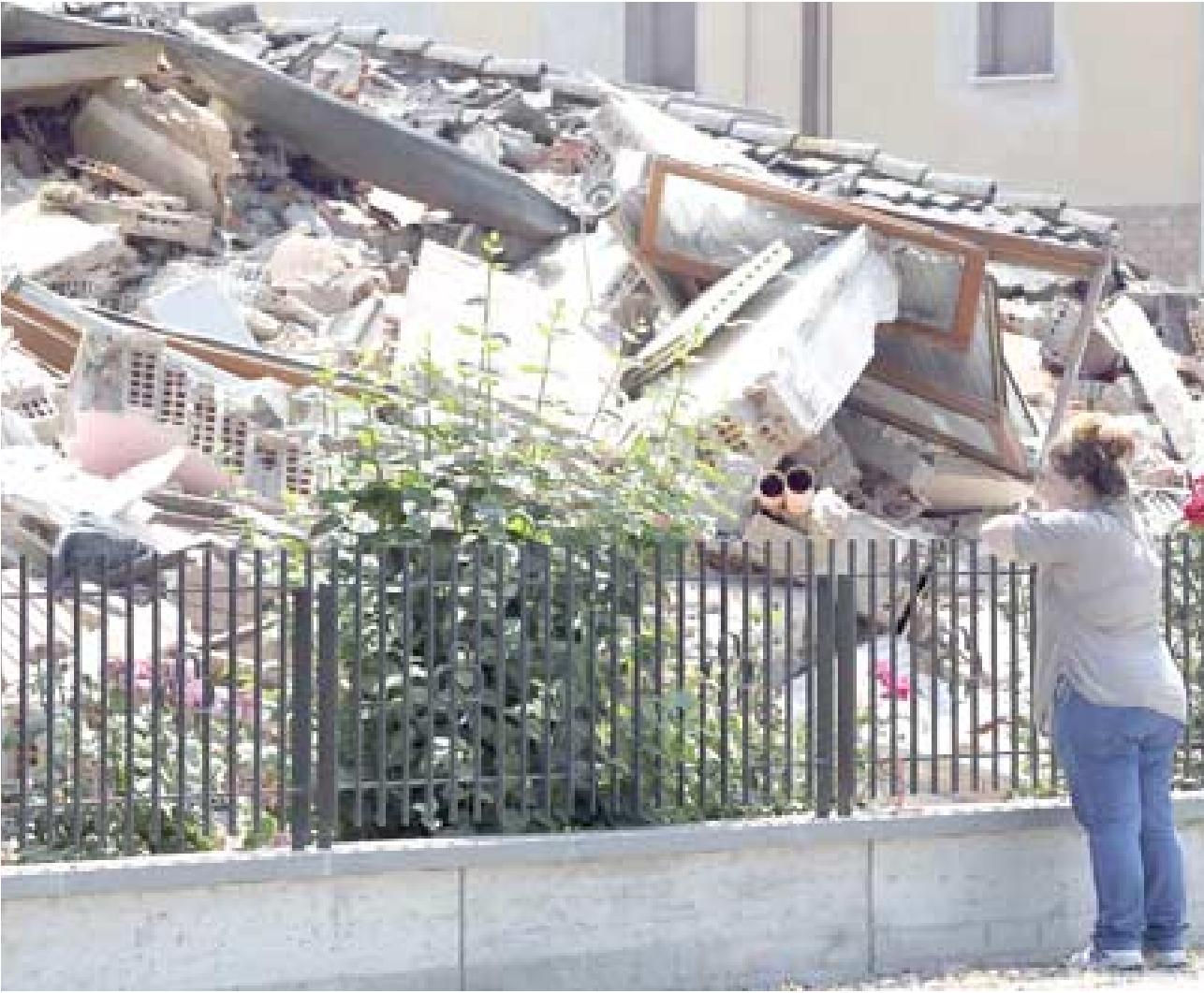
حطام : ايطالية تنظر الى حطام منزل من أثر الزلزال.

وضربت الهزة المنطقة صباح الثلاثاء ووقعت 17 قتيلا و350 جريحا. وانشلت فرق الاطفاء جثة عامل كان مقفودا من تحت اقطاف مصنع قضى فيه ثلاثة من زملائه في ميسولا. وفي 20 ايار/مايو ضربت هزة ارضية المنطقة نفسها