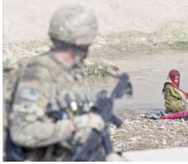
غسيل : فتاة افغانية تقوم بغسل الملابس على النهر (رويترز)

لندن - (رويترز) - أيدت المحكمة العليا ببريطانيا امس الاربعا، ترحيل مؤسس موقع ويكيليكس جوليان اسانج الى السويد بشأن جرائم جنسية مزعومة لكنها امهلته اسيوعين لطلب إعادة فتح القضية. ورفض قضاة على محكمة في البلاد ومجموع سبعاً تأجيله خمساً مقابل اثنين زعم اسانج ان امر الاعتقال الاوربي المطالب ترحيله بموجب باطل. وكانت محكمتان اقل درجة حكمتا بترحيله ويورد ممثلو ادعاء سويديون استجواب اسانج