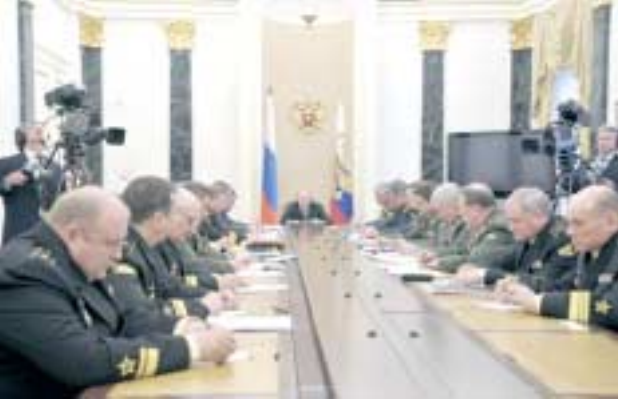
مؤتمراً : يوتيون يشاركون مع مسؤولي وزارة الدفاع في مؤتمر بموسكو.

امر غير مُجد وفقاً لوجهة نظرياً. وأكد ان روسيا تبتذل ما بوسعها لتخفيف حدة المواجهة بين طرفي النزاع السوري. وأضاف ان الجانب الروسي يرى ضرورة التمسك بالخطة التي اقترحها الممثل الخاص بالتسوية السورية كوفي امان، وهي الخطة التي لا نرى بديلاً لها في الوقت الراهن. ويشتر إلى ان نائب وزير الخارجية الروسية غينادي غاتيلوف أعلن امس، ان موسكو سترفض تمرير أية اقتراحات في مجلس الأمن تدعو للتدخل عسكرياً في سوريا، معتبراً أية ضغوطات جديدة على دمشق في العلاقات الثنائية بين الدول المذكورة وسوريا، إلا من منظور الجهود الدولية المبذولة لمساعدة الحل السلمي للامنة السورية.