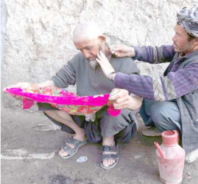
حلاقة: رجل افغاني يمتحن شوارع كابول.

أيضاً لعملاء كلتا الشركتين إمكانية وصول أكبر للشبكية العالمية المتنامية للاتحاد للطيران.