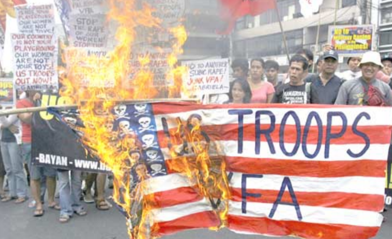
احتجاجات متظاهرون يحرقون العلم الأمريكي احتجاجاً على رسو سفينة حربية أمريكية في حرباً فلبيني (رويترز).

فيينا - (رويترز) - قال دبلوماسيون امس إن إيران والوكالة الدولية للطاقة الذرية التابعة للأمم المتحدة تحترزان تقديراً في التوصل الي اتفاق إطار عمل حول سبيل تهدئة المخاوف بشأن البرنامج النووي للجمهورية الاسلامية. وقد يمثل الاتفاق ورقة تفاوض لإيران في مفاوضات تجري الأسبوع المقبل مع قوى عالمية وتقول إيران إن هناك حاجة لمثل هذا الاتفاق قبل ان تبحث طابا قدمه مفتشون تابعون للأمم المتحدة لزيارة موقع بارشين العسكري الذي يعتقدون انه ربما جرى فيه تجارب لها علاقة بتطوير أسلحة نووية وأجرت الوكالة التابعة للأمم المتحدة محادثات مع إيران هذا الأسبوع في فيينا ومن المقرر ان يجتمع الجانبان مجددا يوم 21 مايو أيار قبل يومين من اجراء إيران والقوى العالمية الست مناقشات لاستقبال برنامجها النووي في العاصمة العراقية بغداد وقال دبلوماسيون غربيون في الوكالة إن إيران بدت حريصة على الموافقة على ما أطلق عليه اسم 'النهج المنظم' وهو إطار لكيفية التعامل مع تسولات الوكالة قبل اجتماع بغداد وذلك على أمل ان يكون لهذا تأثير على الاجتماع