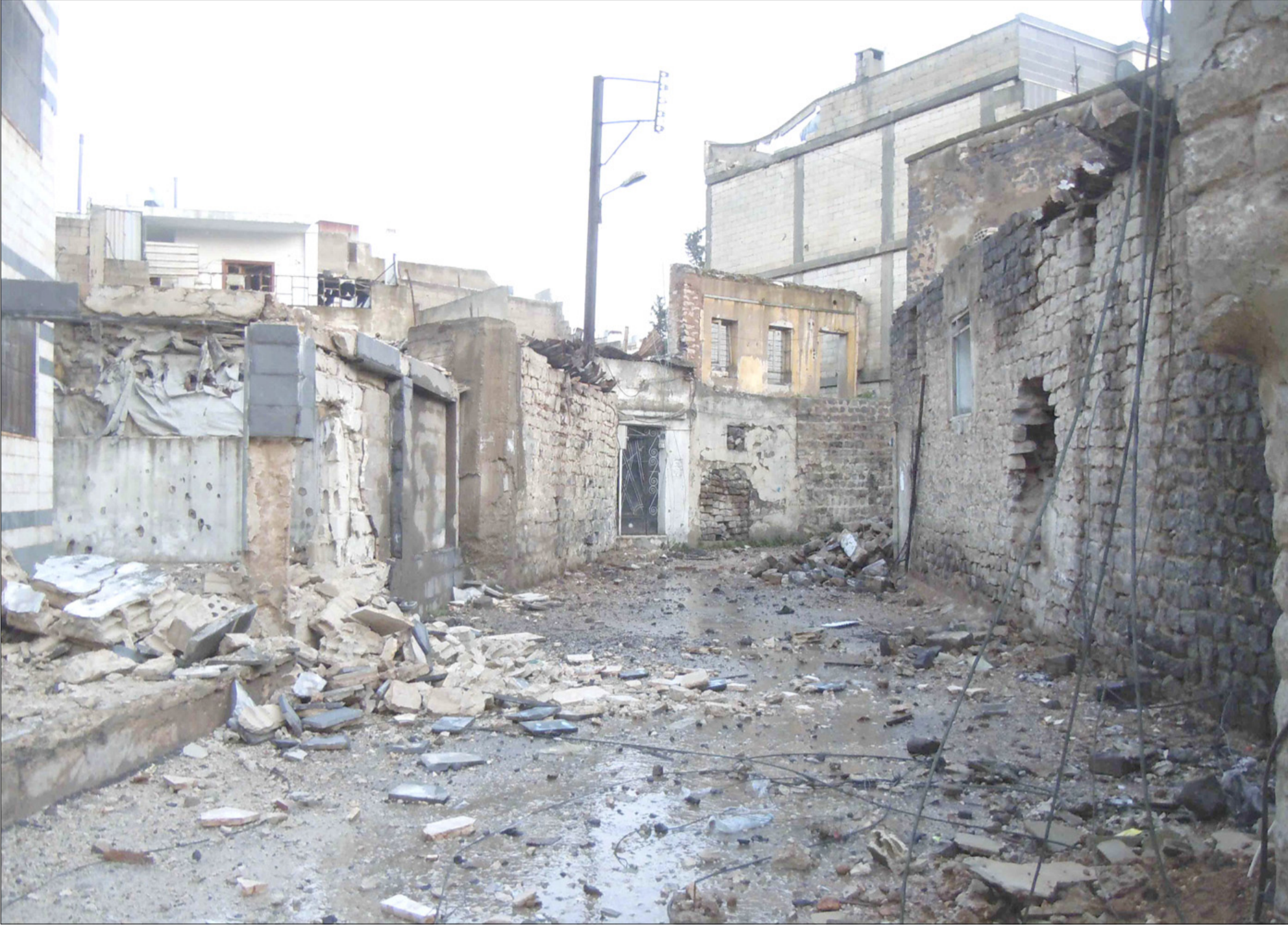
دمار في حي بابا عمرو في حمص