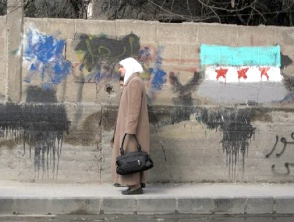
سورية تمر إلى جانب حائط رسم عليه علم الثورة في دمشق امس الاول

□ طهران - يو بي اي: دعا رئيس مجلس الشورى الإيراني علي لاريجاني الى تغيير اسم مؤتمر اسطنبول للمعارضة السورية الى مؤتمر "مانحو الرشوة لإسرائيل لك الخناق عنها". ونسبت وسائل اعلام إيرانية الى لاريجاني قوله امس في جلسة لمجلس الشورى في معرض هجومه على مؤتمر اسطنبول، ان المؤتمر الذي عقد مؤخرا في اسطنبول تحت مسمى اصدقاء سوريا، هو في الحقيقة لم يكن مؤتمر اصدقاء سوريا، وإنما يجب ان يكون اسمه مؤتمر "مانحو الرشوة لإسرائيل" لك الخناق عنها. و اضاف عندما تخصص الحكومة البريطانية 500 الف باوند لإثارة الاضطرابات في المتحدة كثيرا عن التخریب الداخلي في سوريا، وتهتم بعض الدول بالمنطقة رغم ادارتها من قبل أنظمة دكتاتورية، مؤخرا بالديمقراطية في سوريا وهي الآن بصدد تسليح المعارضة للإخلال بالمنطقة وزعزعة نهج المقاومة ضد إسرائيل. يمكن من كل ذلك الانتفاشات الى الاسم الحقيقي لهذا المؤتمر. وقال لاريجاني مخاطباً الدول المشاركة بمؤتمر اسطنبول إن كتم قلقين على الديمقراطية في المنطقة، فلماذا التزمتم بالصمت تجاه الدكتاتورية الوحشية في البحرين، والأنظمة الدكتاتورية في سوريا، ويعارض ويدين أي مامرة أو مغامرة تحمل شعار الديمقراطية كذبا وزورا. من جهة ثانية، اعتبر لاريجاني تصريحات وزيرة الخارجية الأمريكية هيلاري كلينتون حول السياسي: و اردف قائلا ما زال كوفي عنان يتابع خطته للسلام، في حين يعزف هذا المؤتمر نغمة أخرى، لذلك اصبح معلوما ان قضيتكم ليست الإصلاحات في الحقيقة لهذا المؤتمر. وقال ان مجلس الشورى يدعم الإصلاحات الديمقراطية في سوريا، ويعارض ويدين أي مامرة أو مغامرة تحمل شعار الديمقراطية كذبا وزورا. خلال التهجول ان تنهب ثرواتها الإيرانية هو من فوائدها، ولذلك جميع الدول المجاورة.