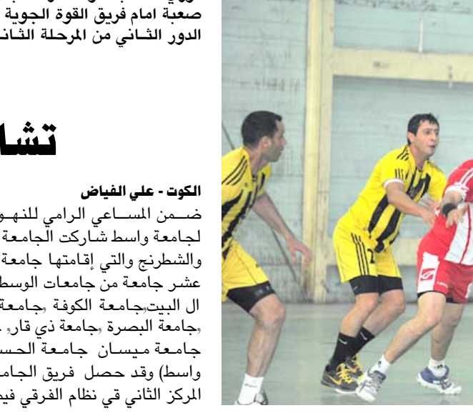
الفرق الصغيرة التي تقف معه من حيث المستوى الفني ومن ثم ترك بصمة حتى على حساب الخروج من البطولة والفوز على اسم جمهوره الذي سيتتابع المباراة لانها مع الجوية وليس لتكرار سيناريو بداية المسابقة التي سرعان ما تخلى عنها لكنه ينظر للامور من جانب آخر حيث التفكير في البقاء الذي يتطلب

وأضاف أن المباراة شهدت إثارة وندية كبيرتين بين الفريقين نتيجة وجود أبرز نجوم اللعبة في صفوف الكرخ بطل الدوري للموسم الماضي وأيضاً فريق الجيش . وأكد حميد أن المباراة المذكورة ومن خلال المستوى الفني عادت بنا الى الزمن الجميل لكرة اليد العراقية خلال الحق الماضي من خلال الفترة الذهبية التي كان اللعبة تعيشها حينذاك .