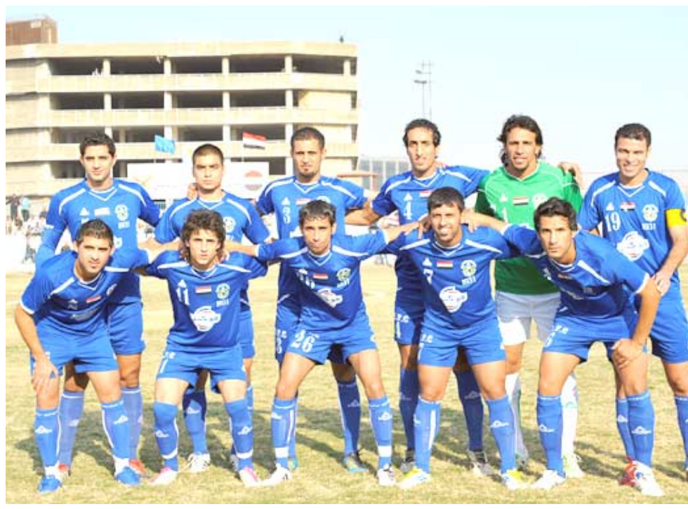
الفرق الصغيرة التي تقف معه من حيث المستوى الفني ومن ثم ترك بصمة حتى على حساب الخروج من البطولة والفوز على اسم جمهوره الذي سيتتابع المباراة لانها مع الجوية وليس لتكرار سيناريو بداية المسابقة التي سرعان ما تخلى عنها لكنه ينظر للامور من جانب آخر حيث التفكير في البقاء الذي يتطلب

بغداد - باسم الركابي تواصل اليوم الأربعاء الرابع من نيسان الجاري مباريات الجولة الأولى من المرحلة الثانية من مسابقة نخبة بكرة القدم وستقام ثلاث مباريات تتوزع بين ملاعب كركوك والتاجي ونفق الوسط وستكون المواجهات المذكورة التي تستهل فيها تلك الفرق مواجهات المرحلة التالية على قدر كبير من الأهمية ولا يمكن التكهّن بباية نتيجتها خاصة وأن أغلب الفرق تريد التخلص من سلبيات النصف الأول من المسابقة التي تتواصل الفرق الصغير والمهددة بالهبوط التي تستهل قبل إعلان استسلامها في ظل الوضع الذي تمر به وما يكشفه الموقف الفني في ترتيب الأندية وهي في حالة خوف شديد لانها ستواجه التحديات بعد ان اكلتها نتائج الجولات الماضية التي شكلت ردا قويا على طمعاتها ويتوقع ان تتصاعد الإثارة والمفاجأة في مسار المنافسات لأن الكل يبحث هنا عن النتائج المطلوبة الجوية في كركوك