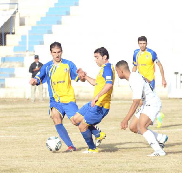
الفرق الصغيرة التي تقف معه من حيث المستوى الفني ومن ثم ترك بصمة حتى على حساب الخروج من البطولة والفوز على اسم جمهوره الذي سيتتابع المباراة لانها مع الجوية وليس لتكرار سيناريو بداية المسابقة التي سرعان ما تخلى عنها لكنه ينظر للامور من جانب آخر حيث التفكير في البقاء الذي يتطلب