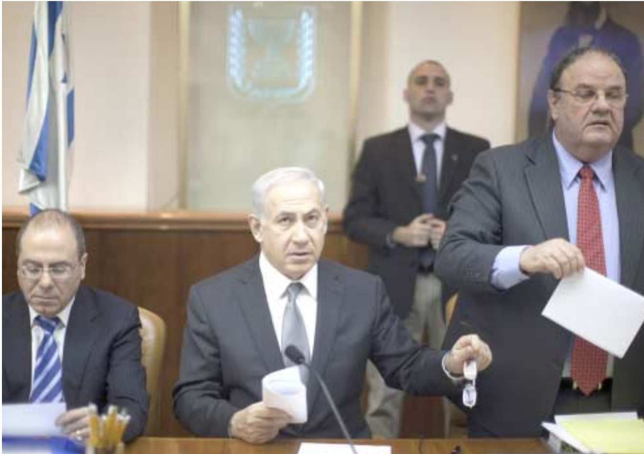
جلسة : رئيس الوزراء الاسرائيلي نتنياهو خلال جلسة للحكومة.

واوضحت الصحيفة ان وكالة الامن القومي تخصصت على اتصالات هاتفية لمسؤولين إيرانيين وتقوم بأشكال أخرى من المراقبة الإلكترونية، تقوم وكالة الاستخبارات الوطنية الجغرافية الفضائية بتحليل الرسوم التي يلتقطها الرادار والصور الرقمية للمواقع النووية. ويقول محللون ان الطائرات بدون طيار تحلق فوق منشآت إيرانية سرية، حسب الصحيفة التي قالت ان لواقط سرية يمكنها رصد الانشارات الكهرمغناطيسية. وانبعاثات الإشعاعات، وضعت قرب منشآت إيرانية مشبوهة. وأضافت الصحيفة ان الولايات المتحدة تعتمد الى حد كبير ايضا على المعلومات التي يجمعها مفتشوا وكالة الاستخبارات للطاقة الذرية بتسلل المنشآت المرتبطة بالقطاع النووي الايراني.