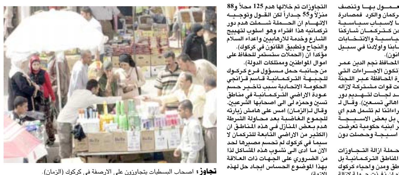
تجاوز : اصحاب البسليات يتجاوزون على الارصفة في كركوك (الزمان).

التجاوزات تم خلالها هدم 125 محلاً و 88 منزلاً و 55 جداراً لكن القبول وتوجيه الاتهام ان الحملة شملت هدم دور تركمانية هذا افتراء وهو اسلوب لتنهيج الشارع وخدمة لارهابيين واعداء السلام والنجاح وتطبيق القانون في كركوك. مؤكدا ان (المحلات مستثمر للحفاظ على اموال المواطنين وممتلكات الدولة). وتبين وحزمه الى اصحابها التشريعي. وقال ل(الزمان) امس على هامش زيارته للجموع الغاضبة بعد محاولة الشرطة هدم بعض المنازل في هذه المناطق ان (الكثير من الاراضي التابعة للتركامان لحد سيمما في كركوك لم تحسم مصيرها لحد الان ما ادى الى نشوب هذه المشاكل لذا من الضروري على الجهات ذات العلاقة بهذا الموضوع الحساس ايجاد حل لهذه الازمة).