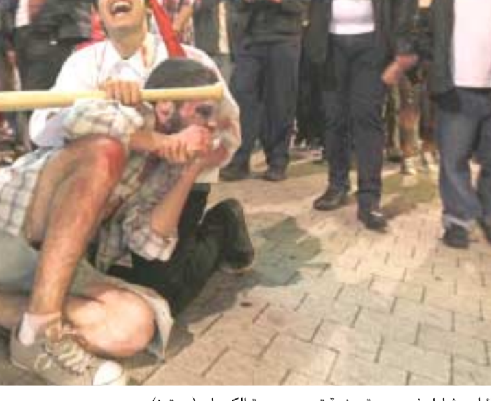
مسيرية : شباب اسرائيلي يشاركون في مسيرة سنوية تسمى مسيرة الكسول.

رئيس الوزراء الإسرائيلي بنيامين نتنياهو للولايات المتحدة واجتماعه يوم الاثنين مع الرئيس الأمريكي باراك أوباما الذي قال ان هذا يتيح فرصة دبلوماسية لنزع فتيل الأزمة حول برنامج طهران النووي وتهمة تطول الحرب. وعلقت كاثارين اشتتون مسؤولية السياسة الخارجية في الاتحاد الأوروبي التي تمقل القوى