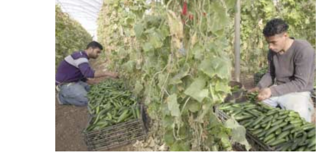
اسواق: فلسطينيون يجنون ثمار الخيار ليبيعا في اسواق الضفة.

وقال وزير الخارجية الإسرائيلي داني أيلون اعتقد انه ليست هناك خلافات مبدئية بين إسرائيل والولايات المتحدة حول ضرورة منع إيران من امتلاك سلاح نووي.