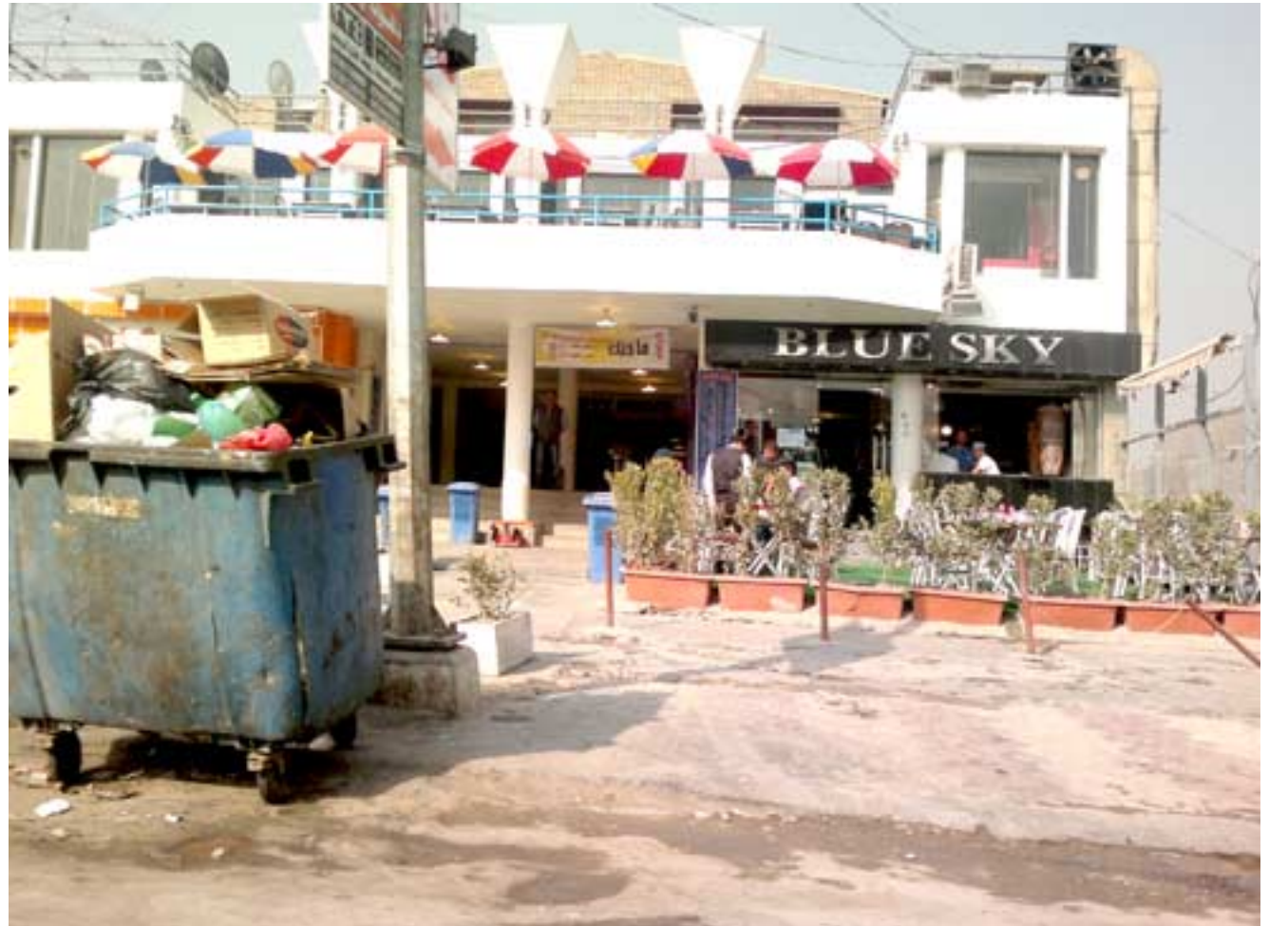
حافية : حاوية تكس النفايات فيها نشوه واجهة احد المطاعم الراقية في بغداد.

وذكر بيان أمس ان الوفد قام بإجراء زيارة ميدانية بالتعاون مع إدارة الكسارك اللبنانية إلى كلا من مرفا ومطار رفيع الحريري الدولي