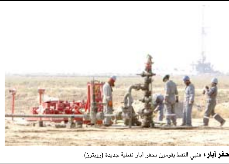
حفر آبار: فني النفط يقومون بحفر آبار نفطية جديدة.

قد وصلت إلى العمق 3701 متر ومن المتوقع البدء بعمليات الحفر الجانبي لتجاوز مشكلة استحصاء خيط الحفر بعد تغزير استخراج (الصيد)، وأوضح المصدر أن (إجهزة الحفر العائدة إلى شركة الحفر العراقية تواصل عمليات الحفر البئر نور 8 بعد نقل جهاز الحفر واستلام الموقع من قبل شركة نفط ميسان تد الشروع بحفر الأنبوب (الموجه)، وأضاف أن (شركة وتر فوردي لصناعة النفط والغاز) تشارك مع الشركة لحفر 20 بئرا نفطيا تواصل أعمال حفر البئر البركان 33 يجري العمل على إنزال البطانة (20 عقدة).